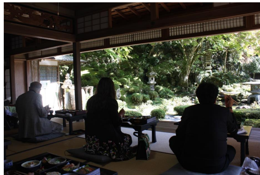
津和野の名園「旧堀氏庭園」を贅沢貸切でお楽しみ