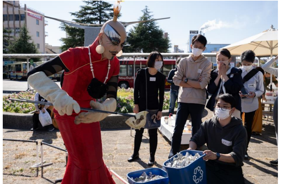
きむらとしろうじんじん“野点”