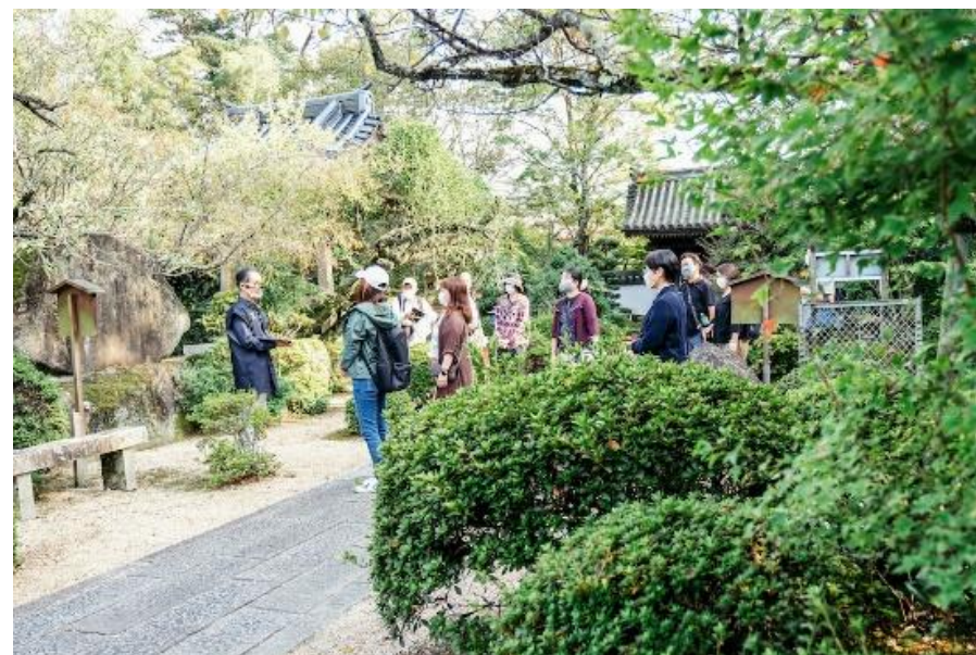
開運！西の京・山口、風水パワスポ巡り