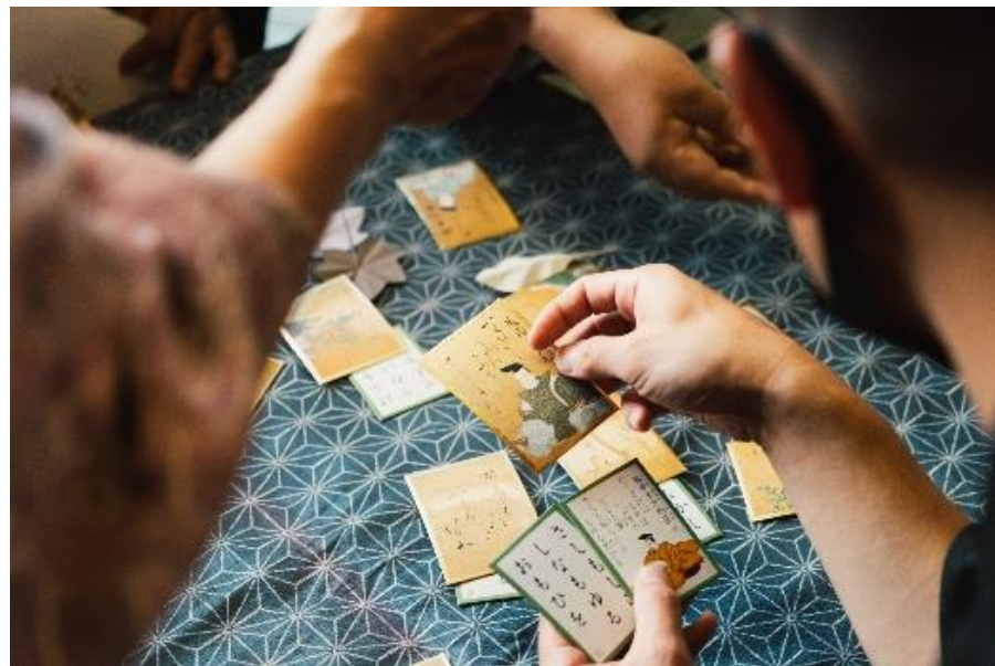
大人の恋にあふれる小倉百人一首「恋すてふかるた」