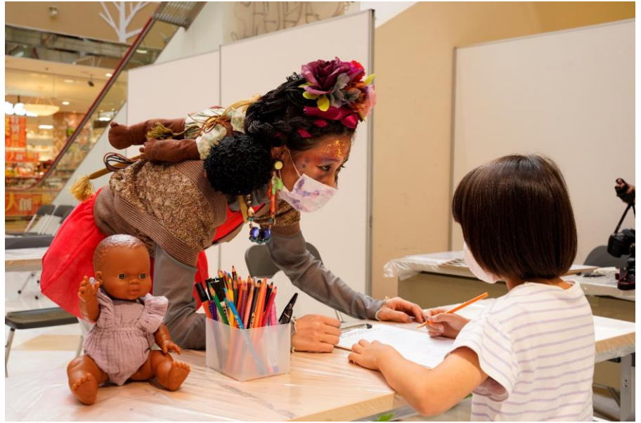
ゾンビママ おいでませ、ぞんぴ