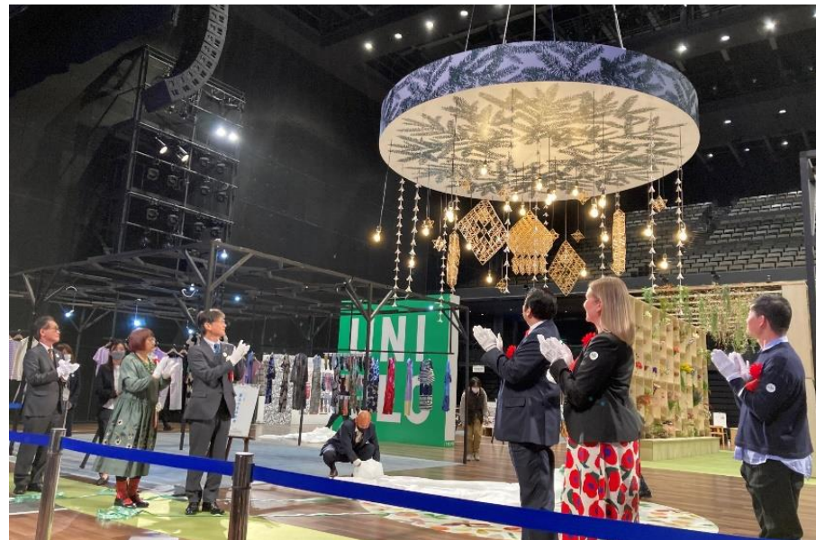
やまぐち×ロヴァニエミ デザインウィーク2021