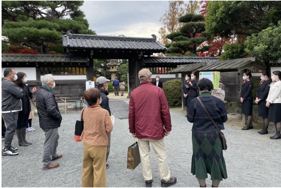
すごいぞ！防府 秋の大イベント(CAガイド)