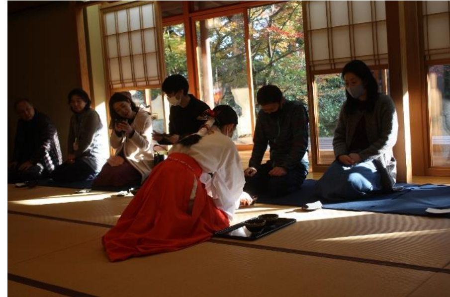
防府幸せますパワースポット巡り2021