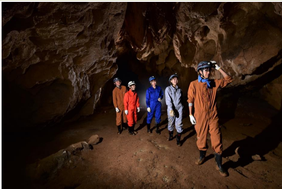
秋吉台の地下で未踏の大洞窟探検ツアー