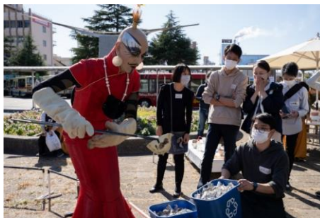
きむらとしろうじんじん“野点”