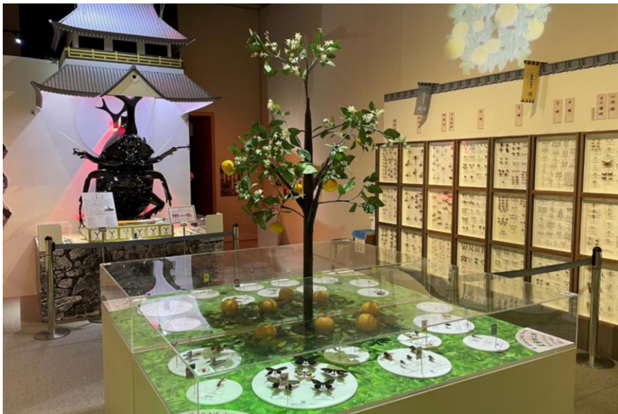
萩・昆虫城 夏の陣