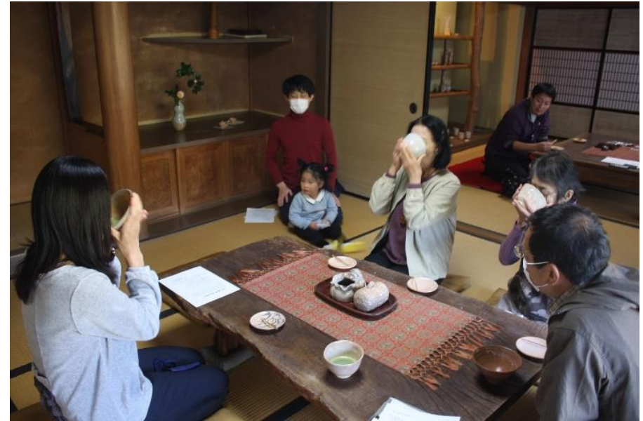
萩ジオツアー「〇〇さんに会いに行こう」