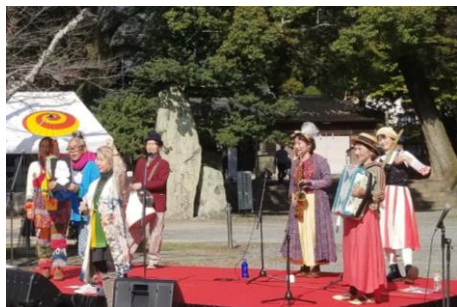
ちんどんおてんきやwithチャンキー松本 ライブ