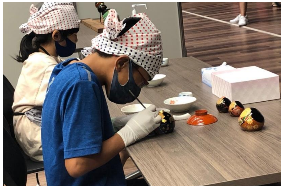
Out of KidZania inやまぐち2021