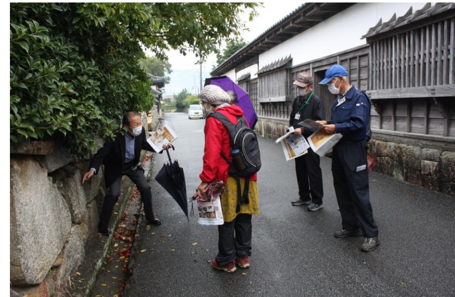
萩博物館元館長と行く 萩ほろほろ歩きツアー