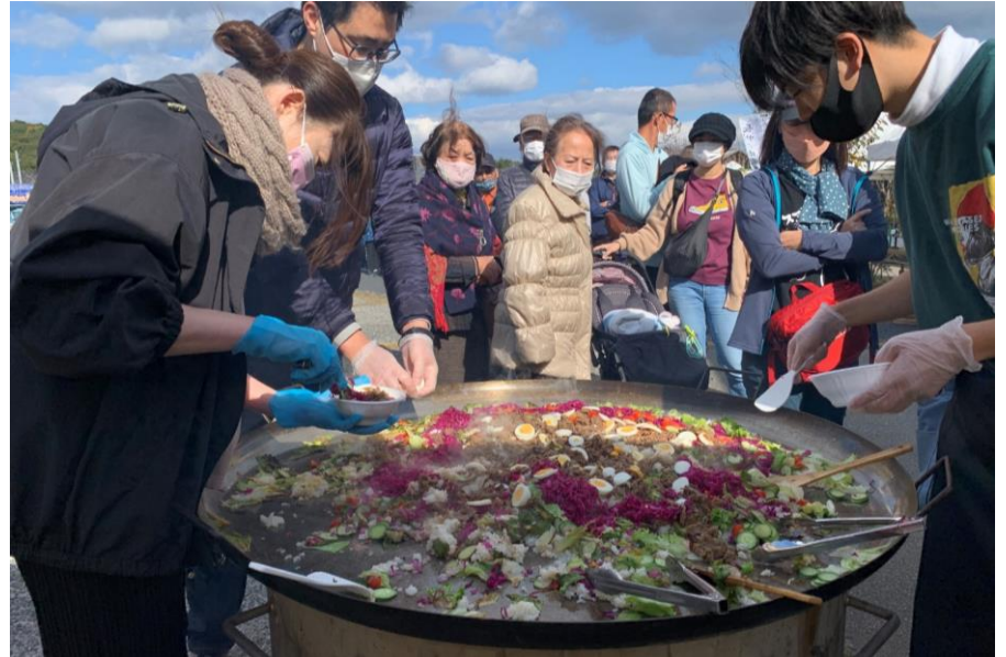
こもれび秋の収穫祭EAT UBE!2021