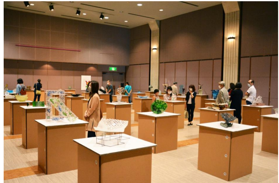
創立50周年記念「'21日本のガラス展」巡回展