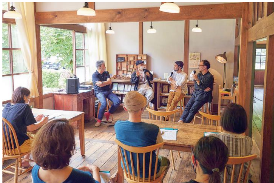
ゆめはくカフェ「医食同源」