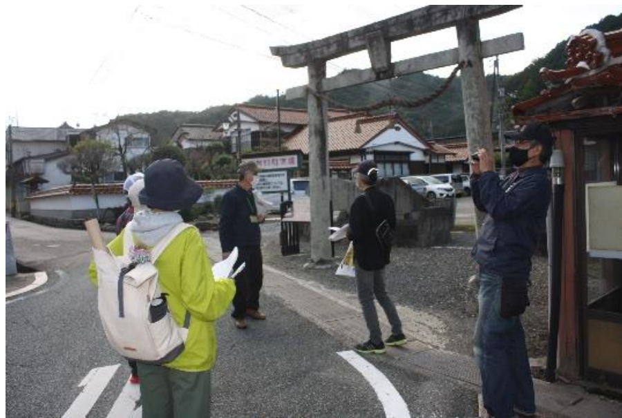
日本遺産ガイドと歩く 秋の津和野路散策