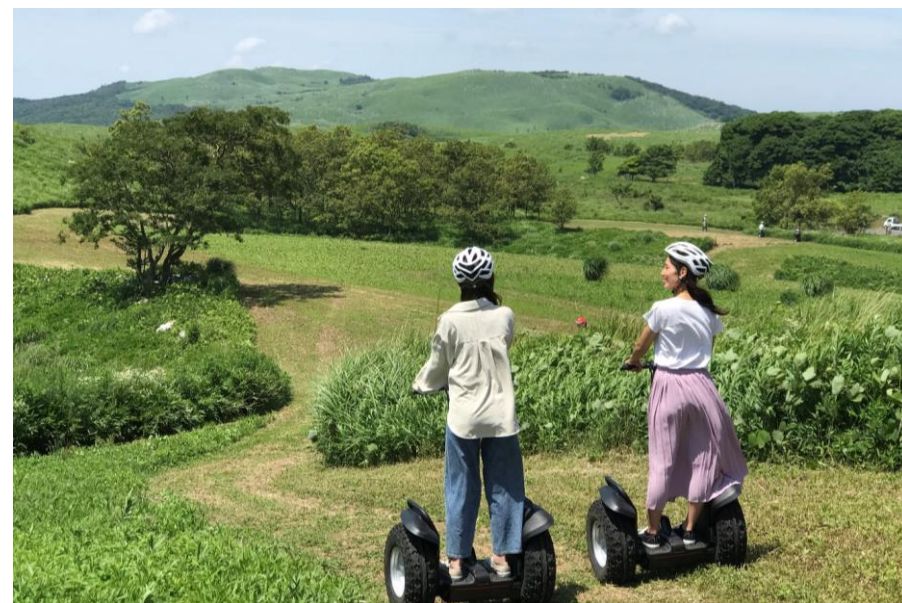
秋吉台でセグウェイに乗ろう！！セグウェイツアーin秋吉台