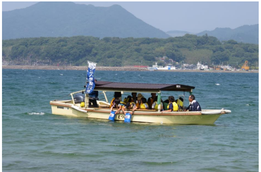
萩八景遊覧船「日本海観賞コース」