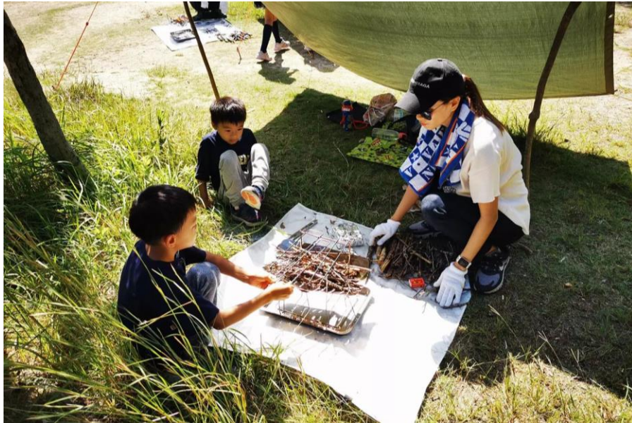
スポーツうべたん(わくわくキャンプ)