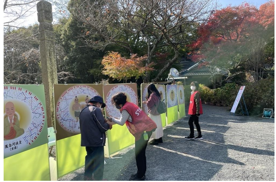
すごいぞ！防府 秋の大イベント(阿弥陀寺)