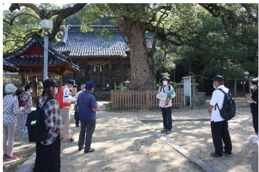
旧山陽道「舟木宿」を観光ソムリエと歴史探訪ウォーク