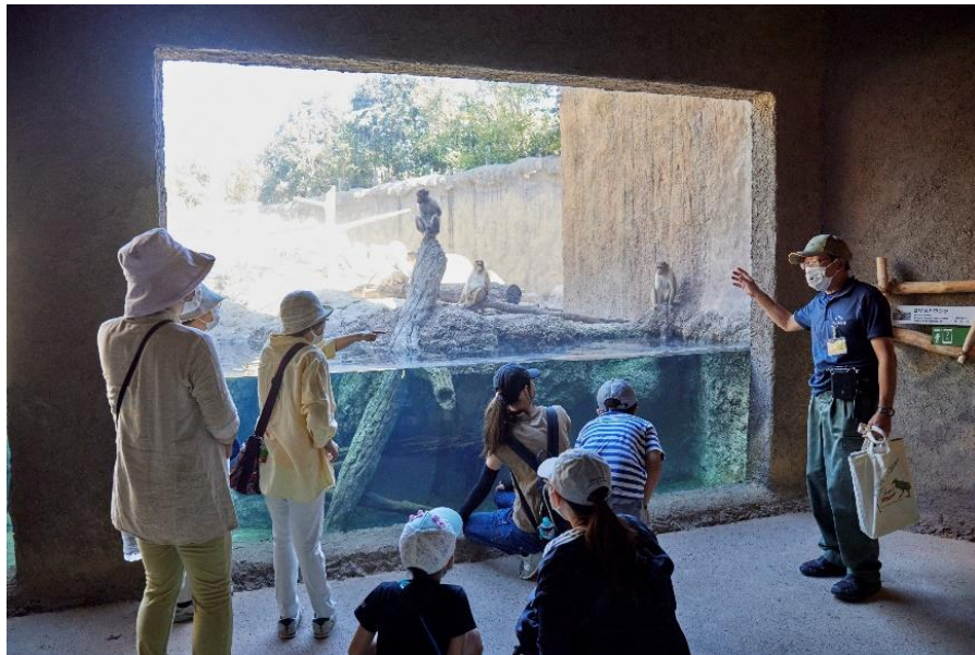
ときわ動物園の裏側を知る！体験プラン