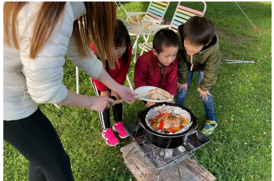
満喫！秋吉台でのアウトドア体験