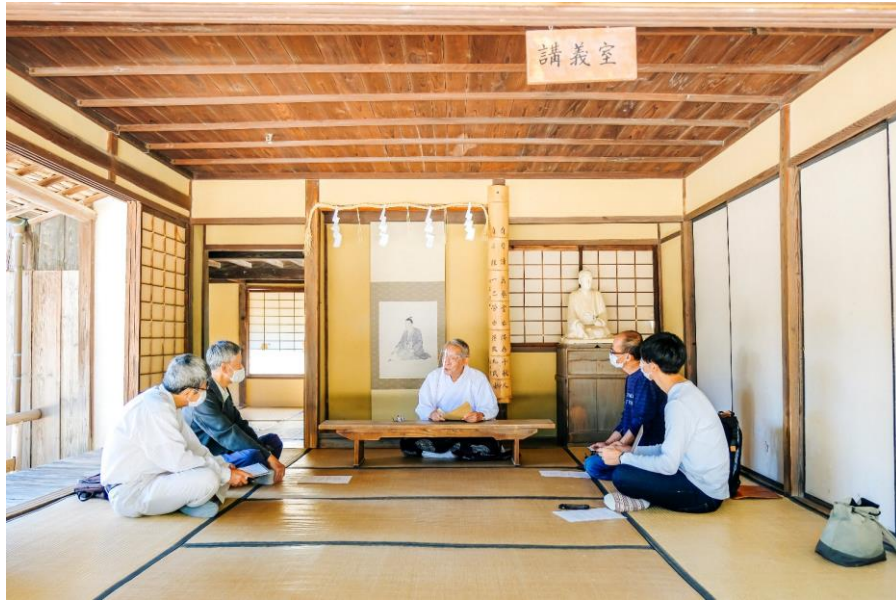
上田名誉宮司又は白上宮司によるプレミアムな松陰神社ツアー