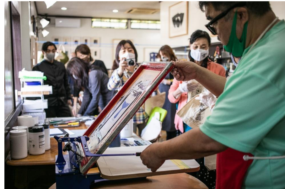
アーティストから調節学ぶ！プレミアムアートツアー