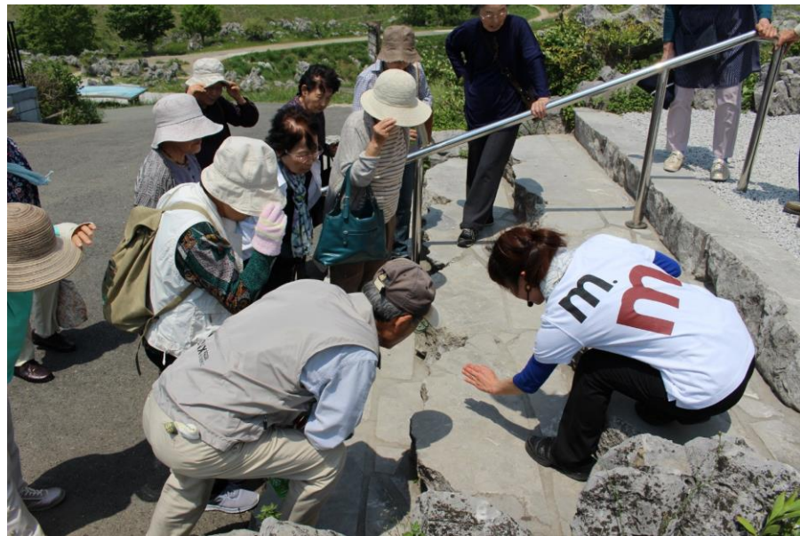
秋吉台で、お手軽ジオツアー(化石)