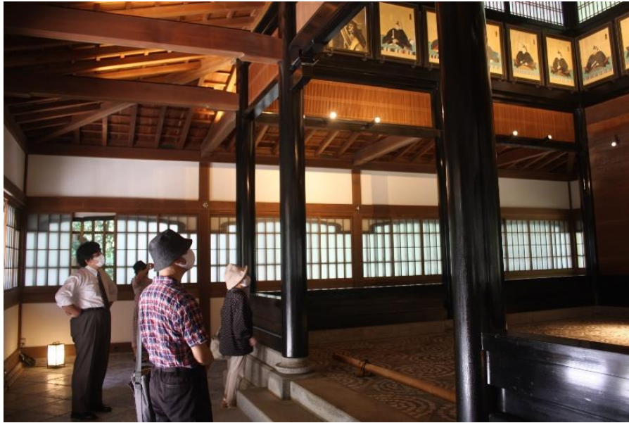
名勝毛利氏庭園を隅から隅まで楽しむ