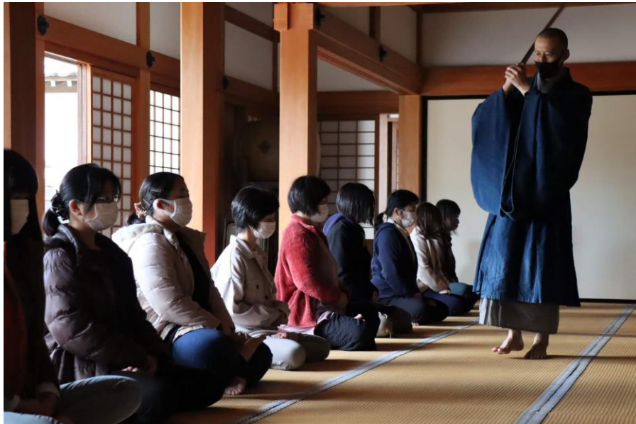
スポーツうべたん(座禅)