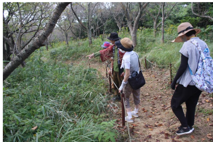
お花の「スペシャリスト」と行く竜王山ネイチャーツアー