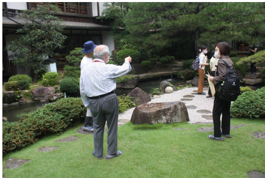
幕末の面影を残す「松田屋」と湯田温泉散策ツアー