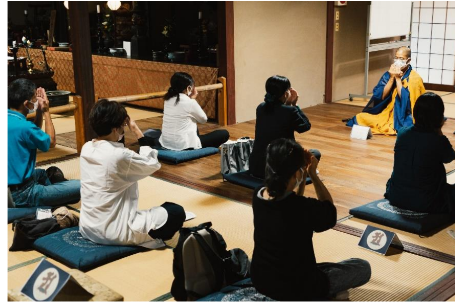
防府幸せますパワースポット巡り2021