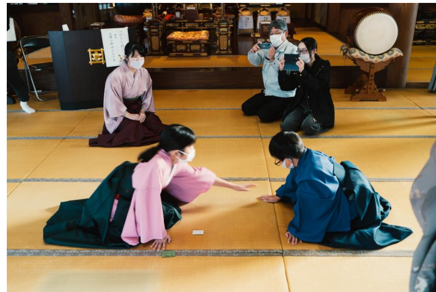
大人の恋にあふれる小倉百人一首「恋すてふかるた」