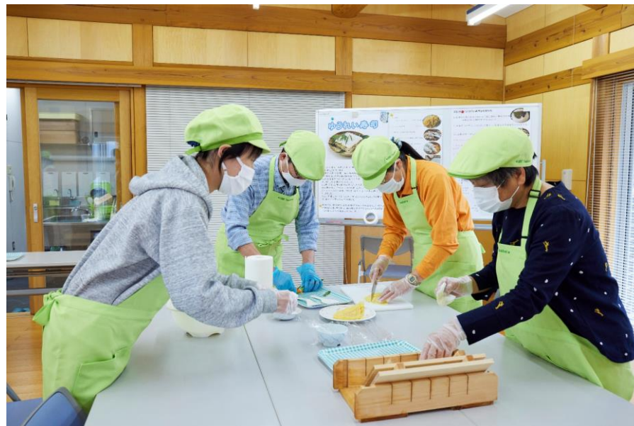
お洒落な田舎を体験！ノースウベdeプレミアム体験