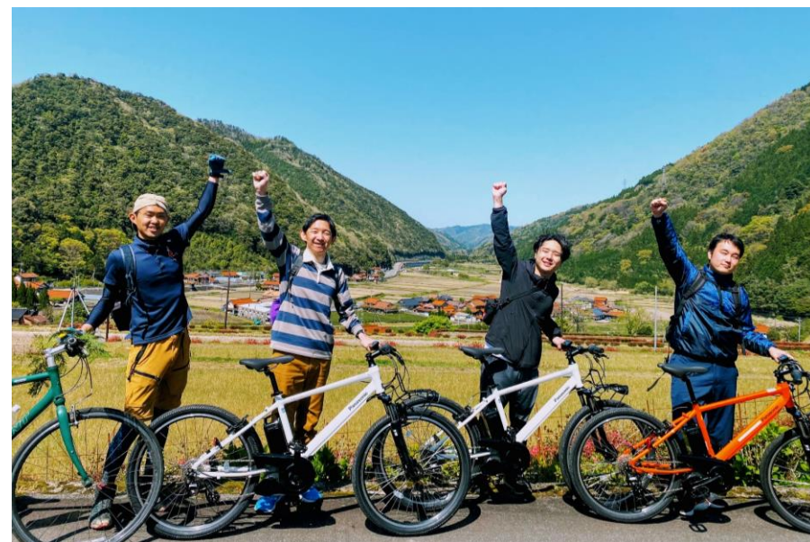
電動アシスト自転車で巡る津和野町の自然体験