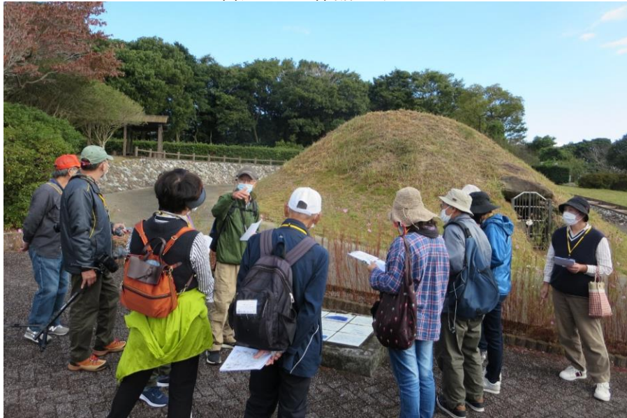
木戸刈屋道とその周辺の魅力を知るウォーキングツアー