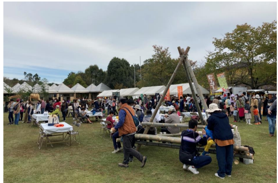
里山フェスin秋吉台