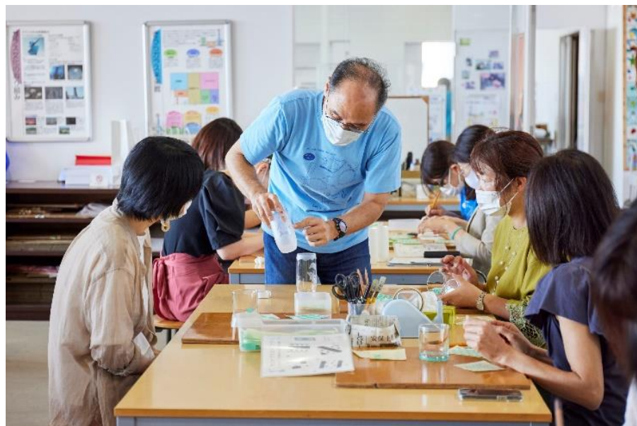
世界に一つだけのガラス作品づくり&おしゃれなレストランでティータイム