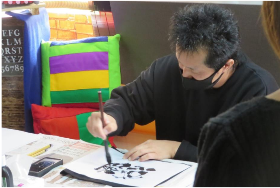
レノファ山口のロゴタイトルを書いた書道家の指導による自分だけの書道アート作品づくり