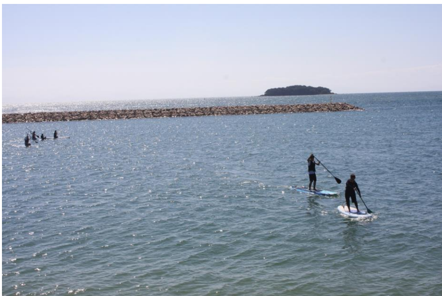
山口市南部・尻川海水浴場でのSUP体験