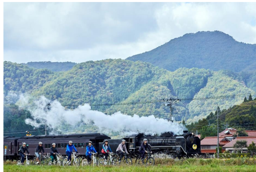
竹製のバンブーバイクで走る 阿東・里山サイクリングツアー