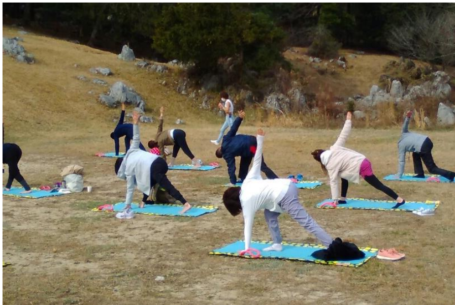
森の中の癒し空間・秋吉台でのヨガ体験