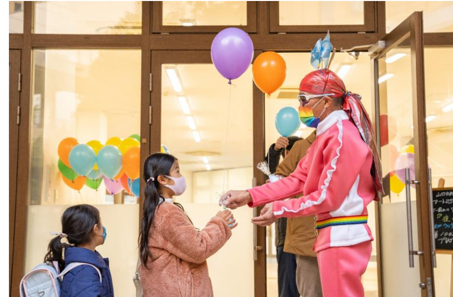
レインボー岡山 夜の虹