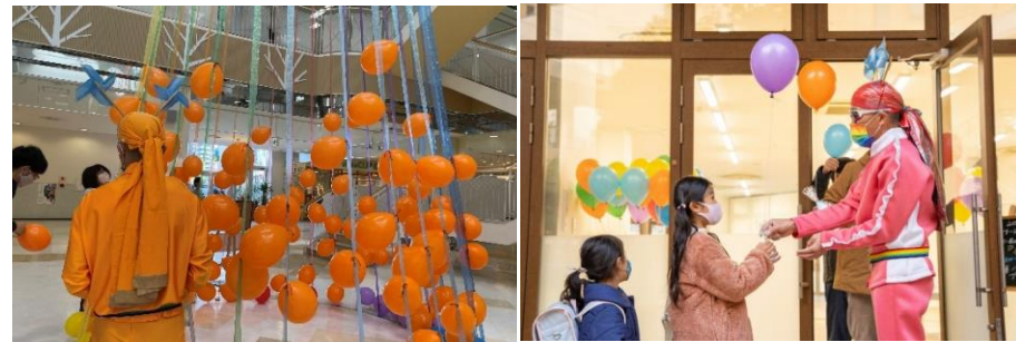
レインボー岡山『7つの虹』