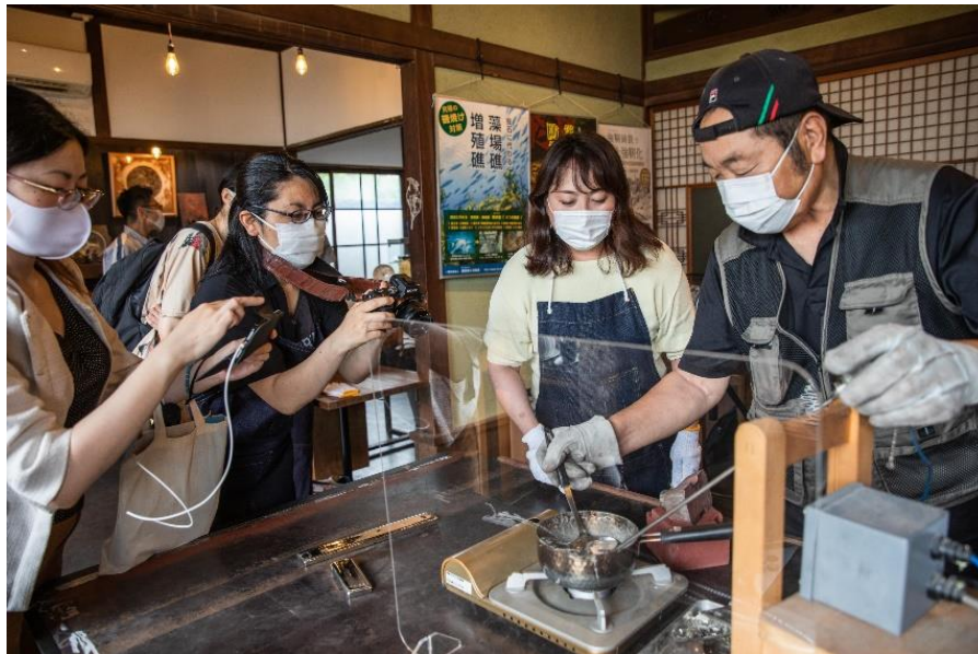
鑄造体験でオリジナル盃作りと山口の地酒飲み比べ