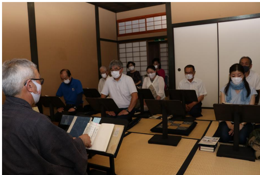
津和野の藩校で論語・古武道を体験しよう