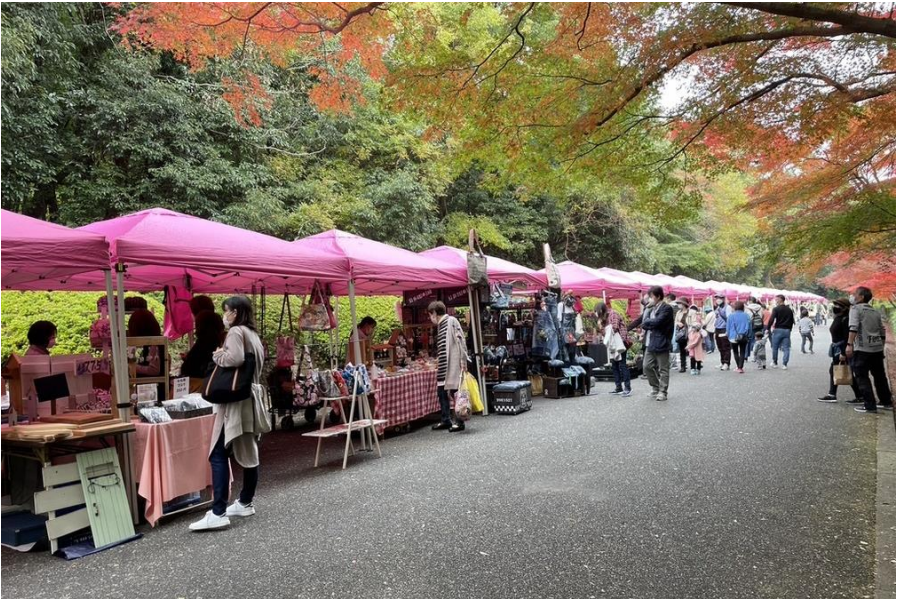
すごいぞ！防府 秋の大イベント(毛利氏庭園)