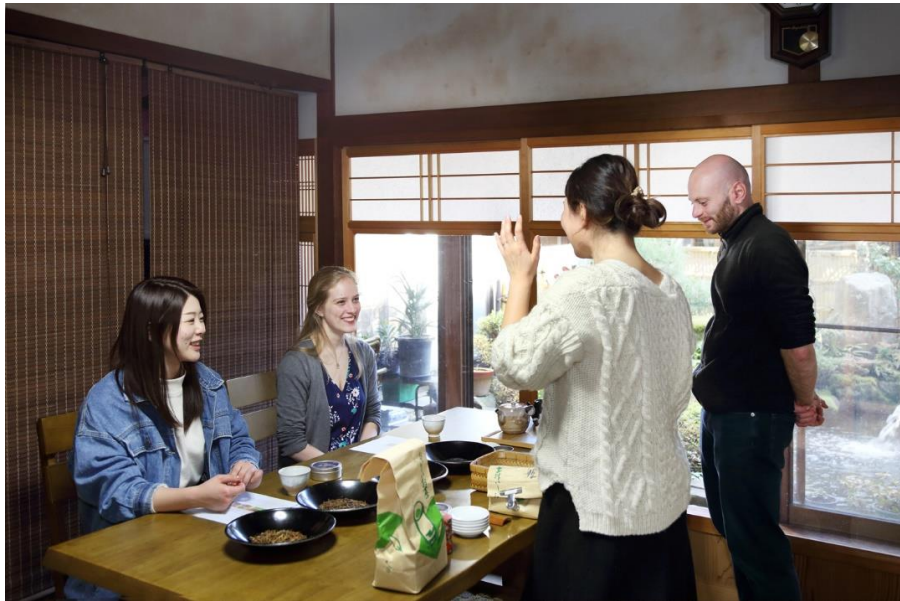
津和野でオリジナルブレンドのお茶を作ってみよう