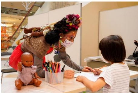
ゾンビママ おいでませ、ぞんび