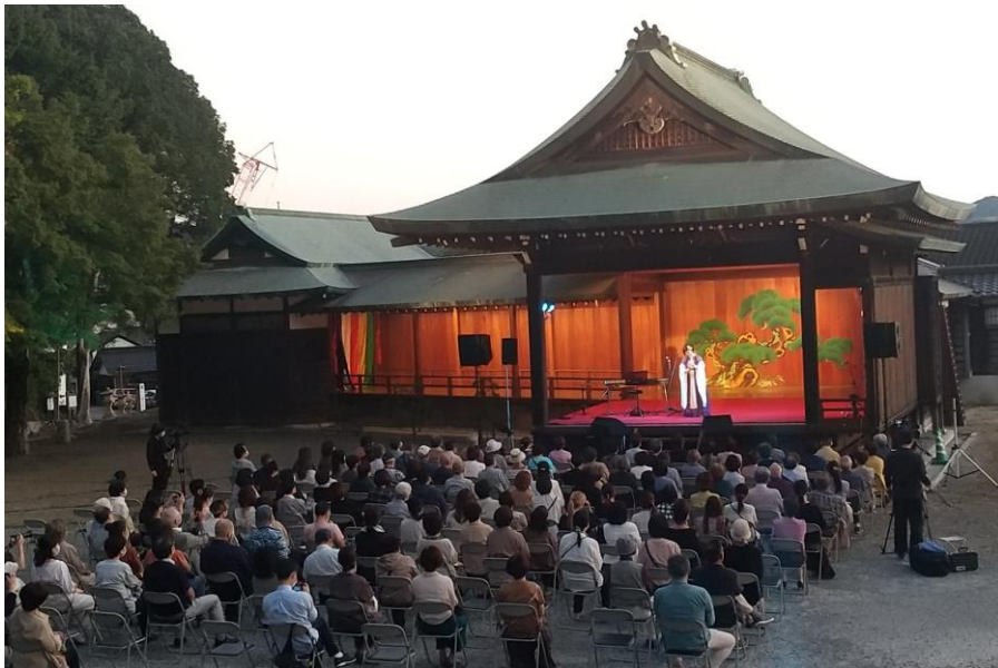
野田神社能楽堂ナイトコンサート