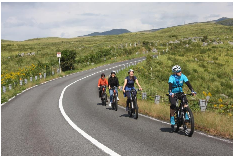
電動アシスト自転車で巡る！！「秋吉台の絶景&名水グルメ」ツアー