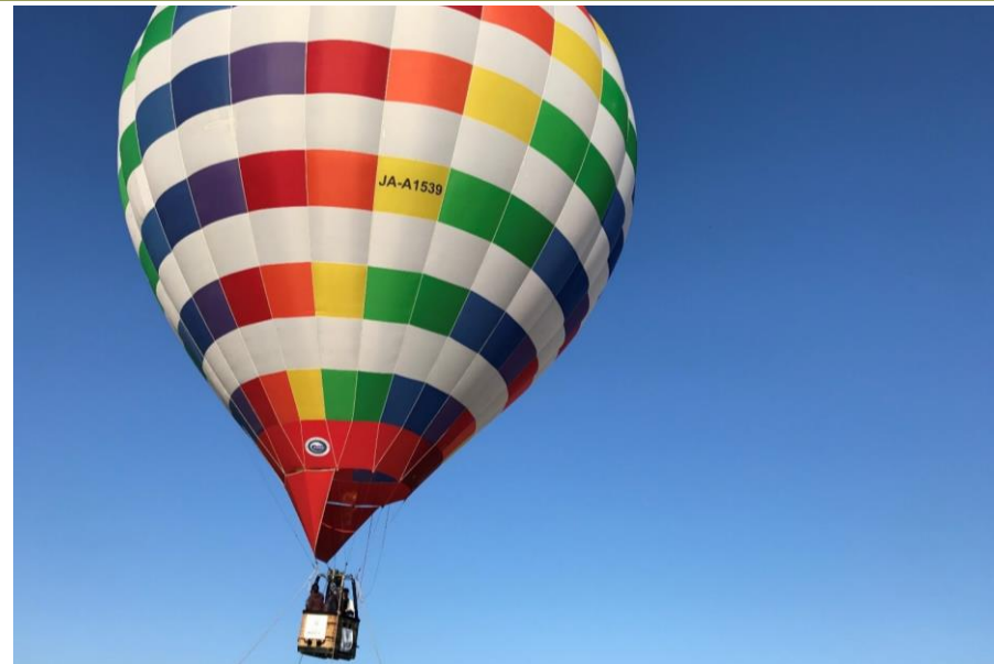
そらから魅る超絶景in秋吉台