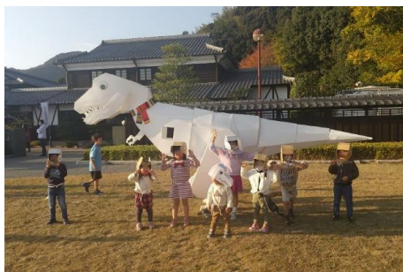
工房ヒゲキタ 出張お散歩着ぐるみ外骨格恐竜“うちのシロ”