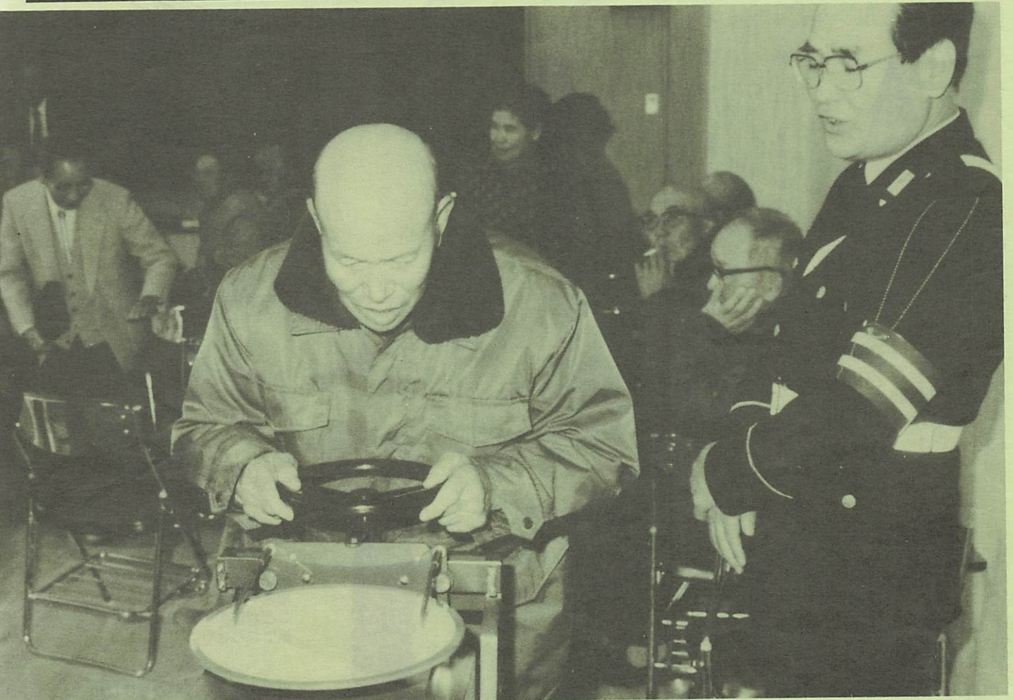
▲注意力とその持続性を調べる検査