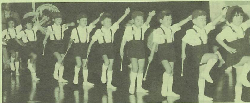
▶横断歩道は手をあげて