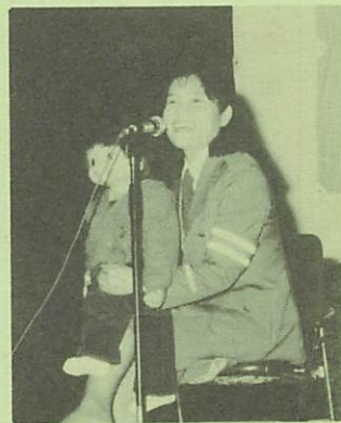
▶人形も交通安全に一役