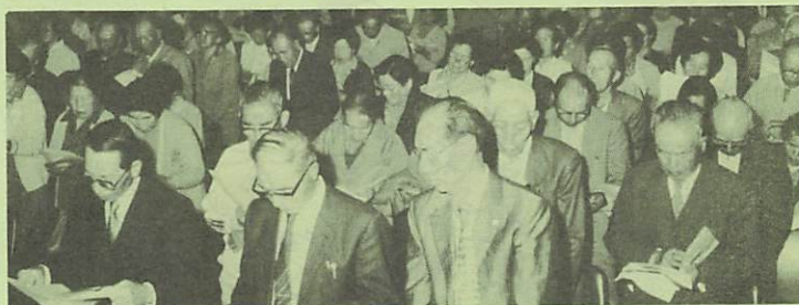
▶みんなで交通安全を守ります