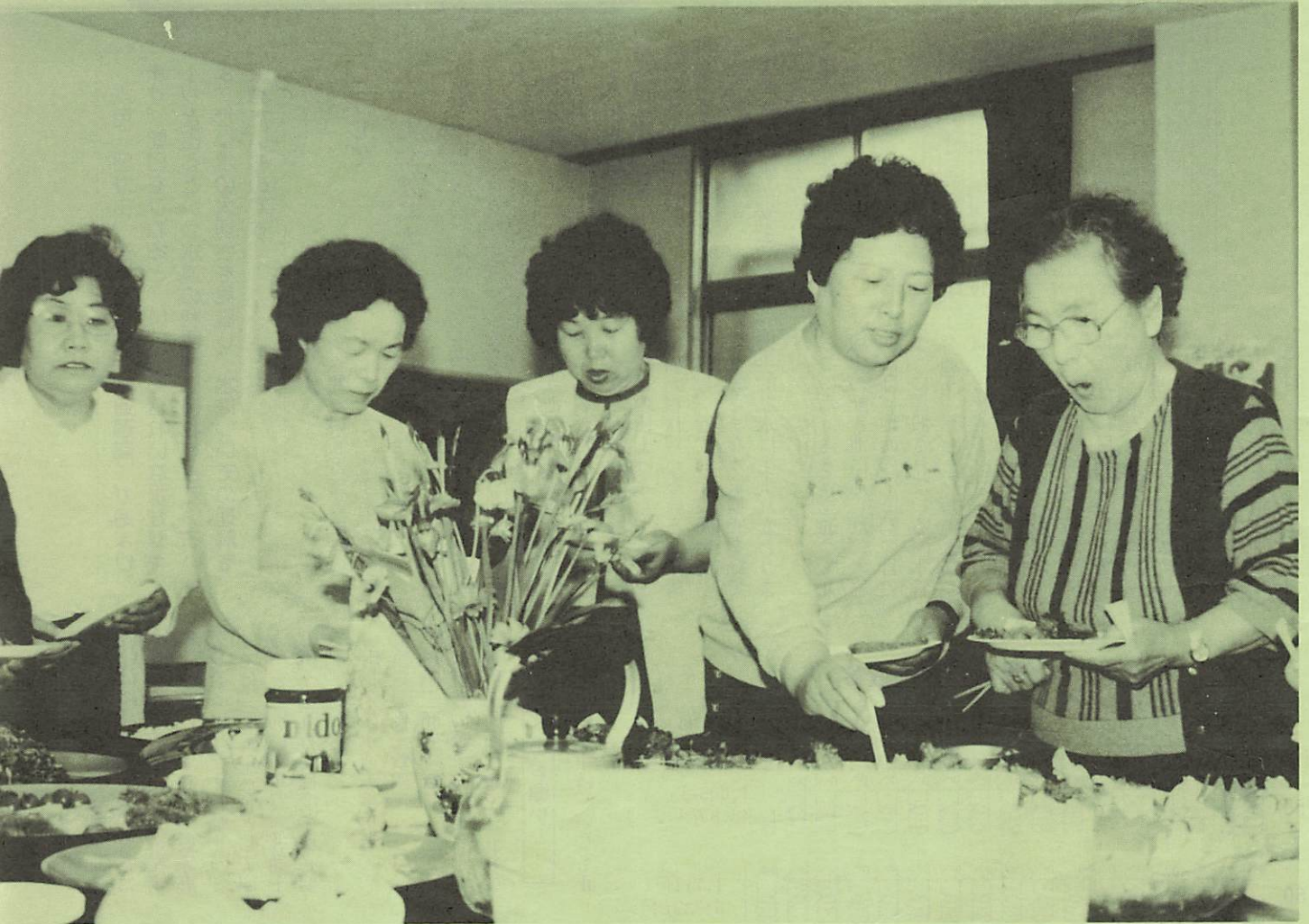
「あれも、これもおいしそう」とつい手が出て……