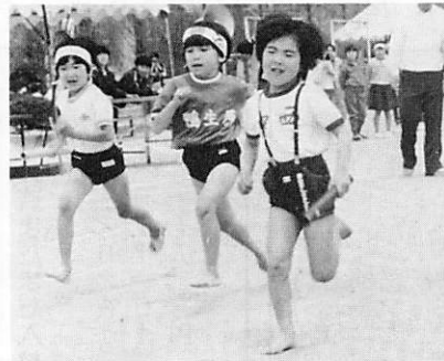
◀「わたし 負けないわ」