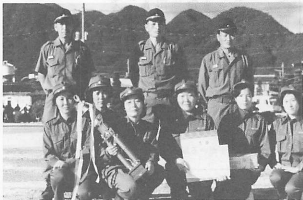
2位に入賞した河内婦人消防クラブ