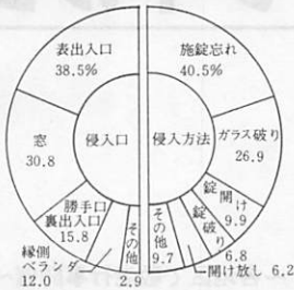
「空き巣ねらい」の侵入口、侵入方法別構成比(昭和57年)