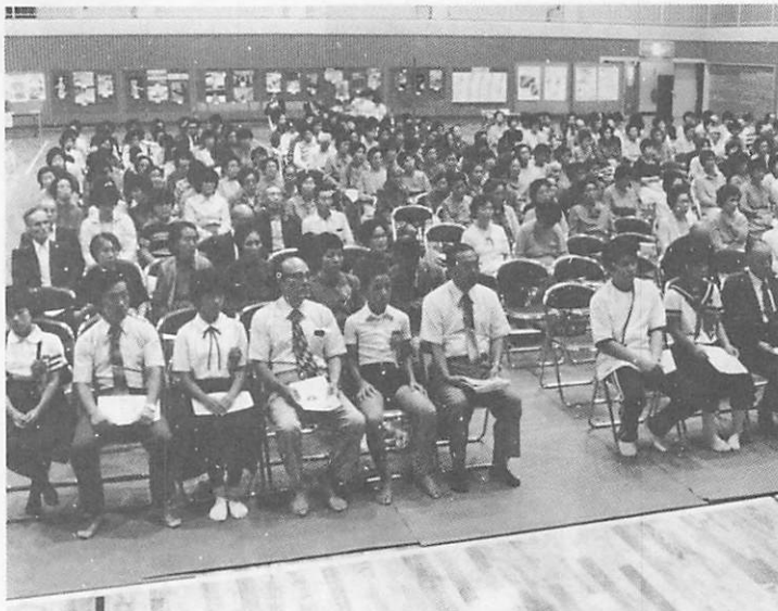
町民体育館を会場に約 350人が参加して盛大に行われた(第4回 徳地町健康づくり推進大会)

九月二十六日、町民体育館に町内から約三百五十人が参加して、第四回徳地町健康づくり推進大会が開催されました。 現在は、生活環境の多様化、生活の不適正、運動不足など、健康を害する要因が多く肥満、貧血、高血圧などの慢性疾患が増加しています。 この大会は、健康づくりの三本柱である「栄養」「運動」「休養」の大切さを認識し、健康づくりを実践していただこうというのがねらいです。 当日は「住みよい・きれいな環境を目指し健康で明るい町づくり