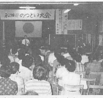
島地地区母のつどい大会