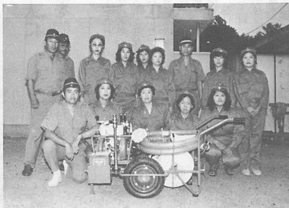
島地団地婦人消防クラブへ

9月22日、山口県消防操法大会が山口県消防学校で開催され、徳地町から応急自動車ポンプ操法に役場分団が、水バケツ消火競技に河内婦人消防クラブが出場しました。日ごろの訓練の成果を発揮した結果、役場分団は惜しくも入賞を逸しましたが河内婦人消防クラブは、見事2位に入賞しました。