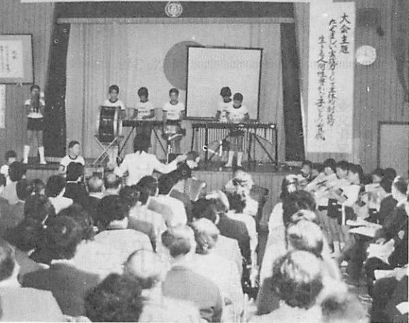
参加した先生たちに成果を発表する子供たち(三谷小で)