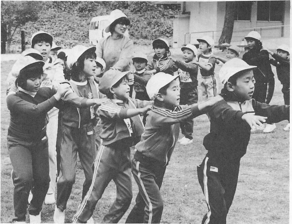
集合学習野外活動（長者ヶ原グリーンスポーツ広場で）