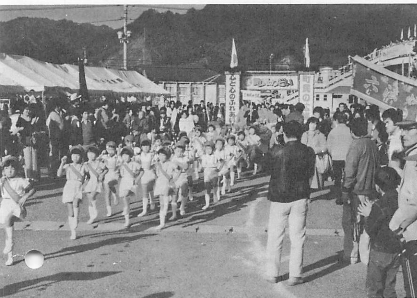
町民のつどいはパレードから始まります (写真は第6回町民のつどい)