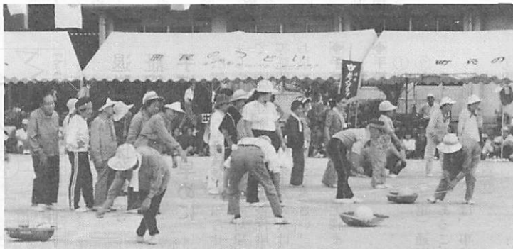
▲あわてないで、安全運転ですよ (老人スポーツ大会で)