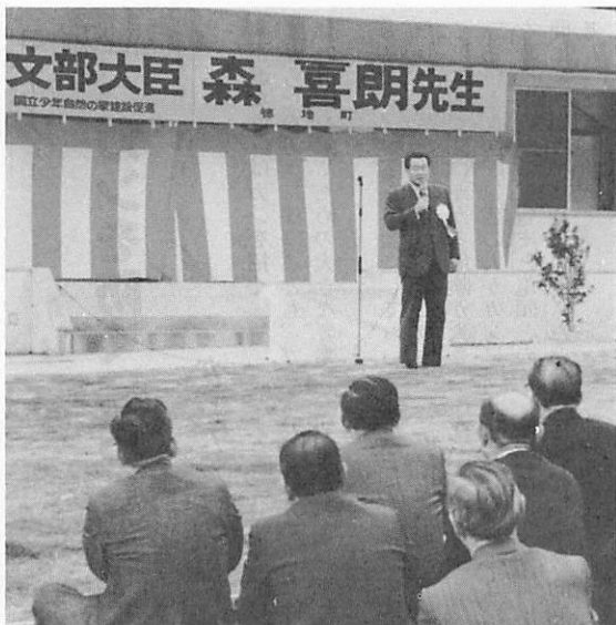
▲あいさつをする森文部大臣 (長者ヶ原で)