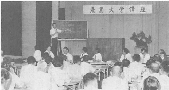
熱心に行われた全体討議