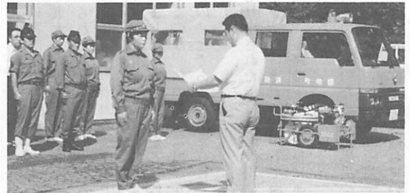
柚野公民館前で行われた交付式

地域消防の充実をはかるため、軽可搬ポンプが河内婦人消防クラブへ、可搬ポンプ付積載車を役場分団にそれぞれ交付され、その交付式が9月2日柚野公民館前で行われました。