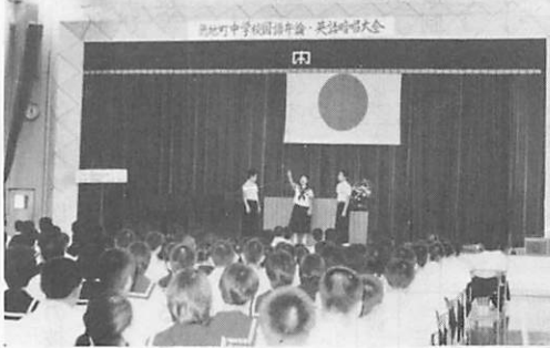
中学校国語弁論・英語暗唱大会 堀中で34人熱弁を奮う

二十八回の伝統をもつ町学校文化展が、十一月二日から四日まで開催されます。 町内の保育園・幼稚園・小学校・中学校の園児・児童・生徒の平素の学習の成果や夏休みの作品のすぐれたものを一堂に展示し、一般に公開いたしますのでぜひおいでください。 ●会場 山村開発センター ●時間 八時三十分～十七時 ●展示内容 ○習字展 ○理科・科学展 ○図工・美術展 ○技術・家庭展