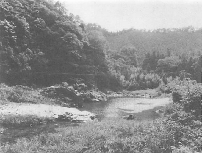
蓮華坊がいかだとともに沈んだといわれる僧取淵