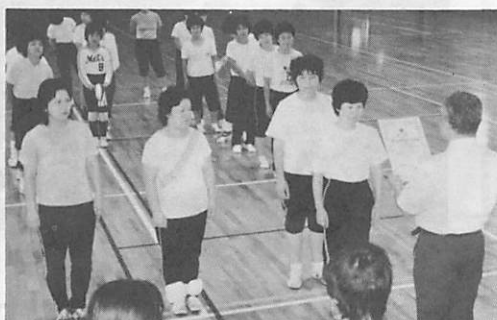
総合体育大会バレー表彰式