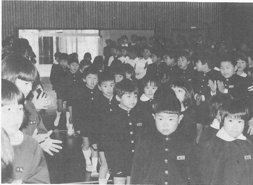
中央小での新入生入場