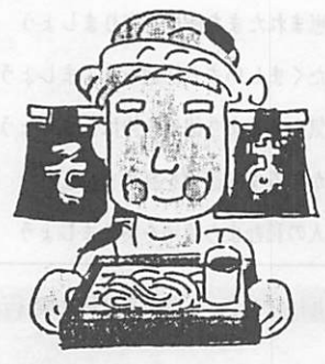
20歳以上60歳未満の自営業者等(第一号被保険者)

いままでの国民年金は農業や漁業、そして商店などの自営業の人など、職場の公的年金制度に加入できない人を対象とする年金制度でした。民間の企業に勤めるサラリーマンや公務員は厚生年金、共済年金に加入し、その奥さんは、希望する人だけが国民年金に加入するというのが、いままでの仕組みでした。この四月からの新しい国民年金では、ごく一部の人を除き、誰もがまず国民年金(基礎年金)に加入することになります。加入する人は次の三つのグループに分けられます。