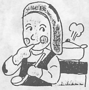
厚生年金、共済年金の加入者の20歳以上60歳未満の被扶養者(第三号被保険者の奥さん)