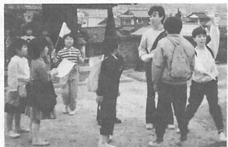
船路宗円寺での子どもたち