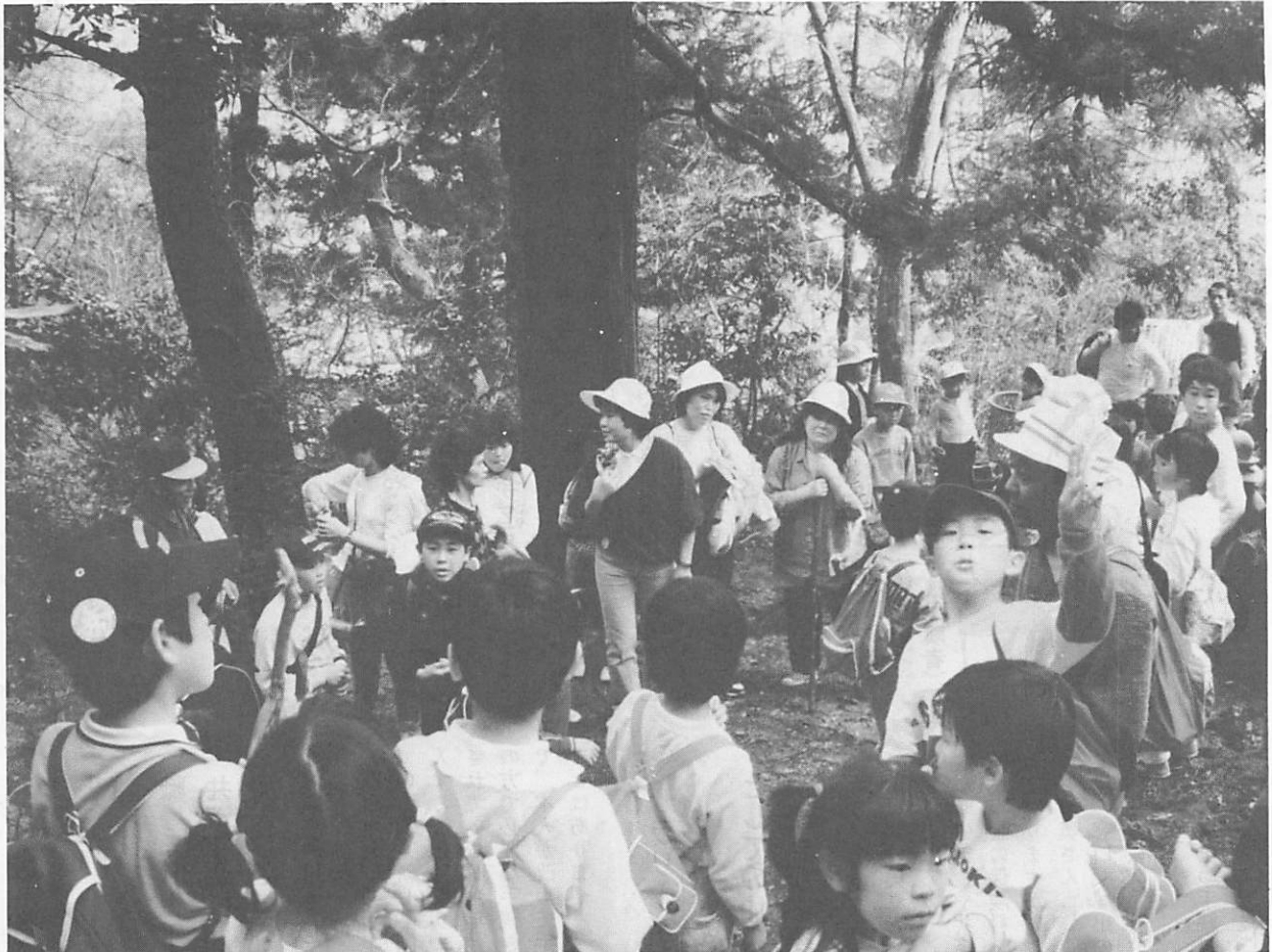
くぐり岩付近で休憩中の参加者のみなさん