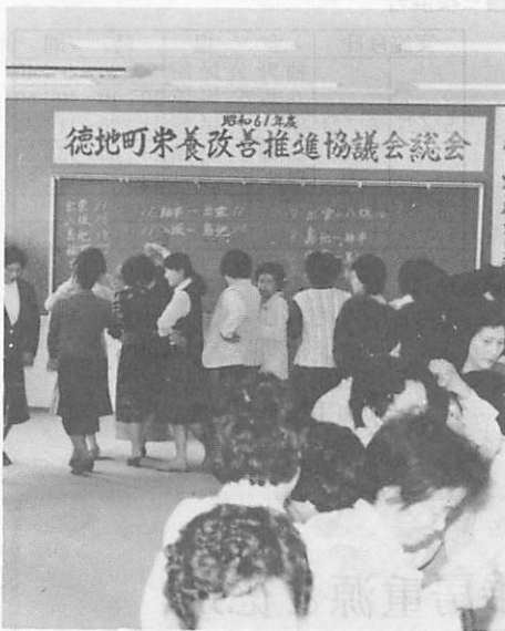
フォークダンスで汗を流しました

本年度町内の入学児童総数は、男子 57 名 女子 75 名 合計 132 名でした。