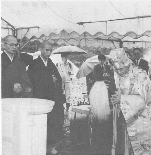
町内仏教団による重源上人の供養式典

記念式典は重源上人が杣始めの祈念祭をしたと言われる(防府市阿弥陀寺の記録による)引