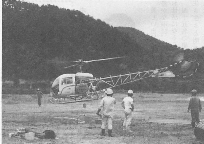
薬剤積込中のヘリコプター (60年6月撮影)