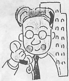
厚生年金、共済年金の加入者(第二号被保険者)