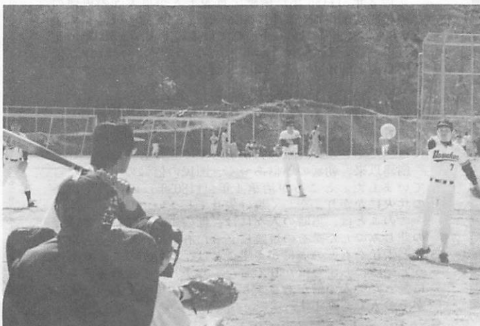
さて、ピッチャーフライ、キャッチャーフライ

4 月 16 日、保健センターにて、「町栄養改善推進協議会総会」が開催され、総会終了後、研修会を開き、「活力のある推進活動をするために」 ・自己紹介の方法。・リフレッシュを取り入れ、うち解ける方法。などの研修を受け今後の地域活動に、役立てます。