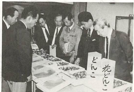
審査委員による、慎重な選抜がされました。