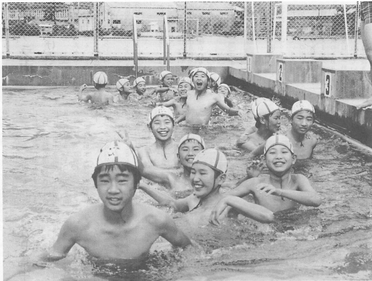
チョット寒いけど ヘッチャラだい

中央小学校では6月24日雨続きのあい間をぬって、6年生で、プール開きが行なわれました。