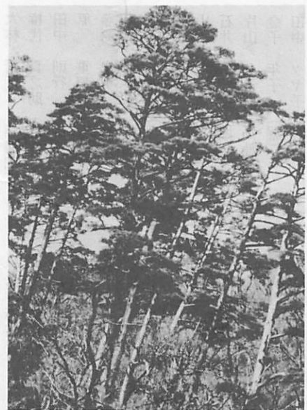
滑国有林内の赤松林

柚とは、柚山、柚地などといわれ、松、杉、檜等の建築用材が立っ ている山を指して、これを簡単に柚と呼んだのであるが、そこで働 く「柚工」もまた柚と呼ばれていた。