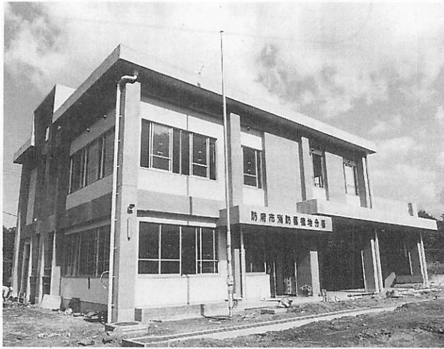
▲消防車2台、救急車1台、連絡車1台が入る徳地分庁舎

町の消防業務もいよいよ十二月一日から、防府市消防署徳地分署として中国自動車道徳地インターの北側で業務を開始します。 徳地分署は、防府消防署職員十七名が二交替制で勤務し、消防団員三二〇名と連携をとり皆さんの生命と財産を守るため活動します。