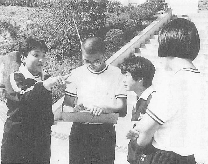
▲オリエンテーリング前のオリエンテーションでコミュニケーションを