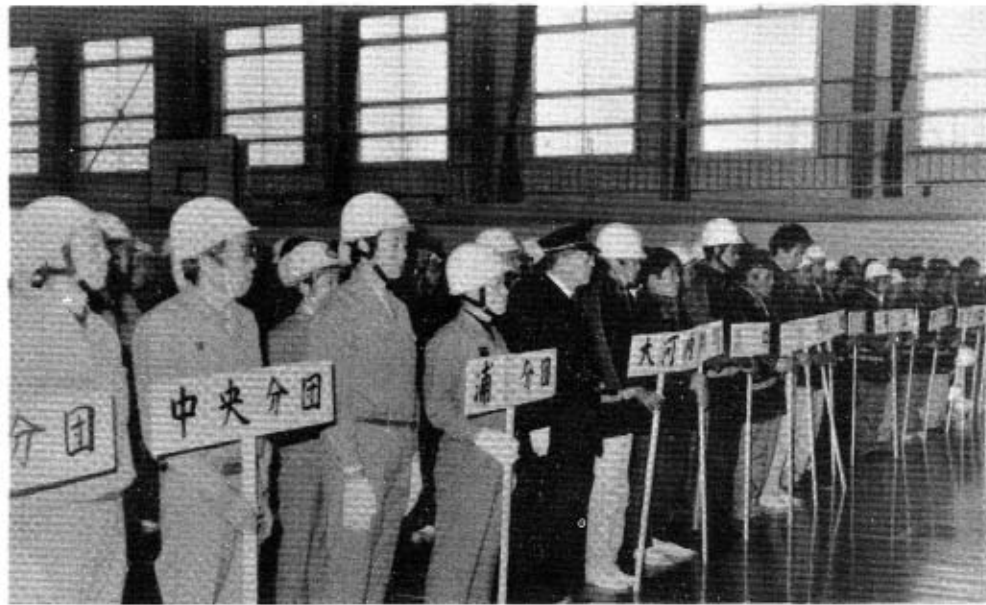
勢ぞろいした消防団員

新春恒例の秋穂町消防出初め式が、一月五日午前九時三十分から秋穂小学校体育館で来賓多数のご臨席のもと、町設消防団員、自衛消防団員併せて二百五十人が勢ぞろいし、盛大に挙行されました。当日、表彰されたかたがたは次