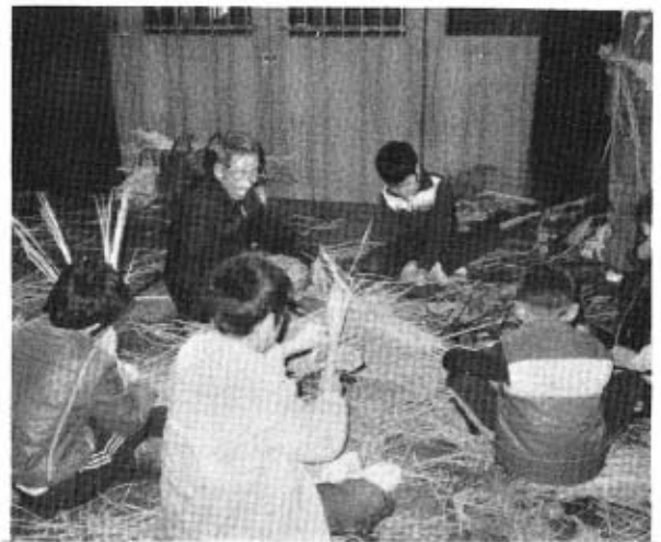
12月26日(日)中央公民館と大海分館の二会場で開催した伝承グループのかたがたのご指導で、しめ飾り作りの講習会を開催しました。