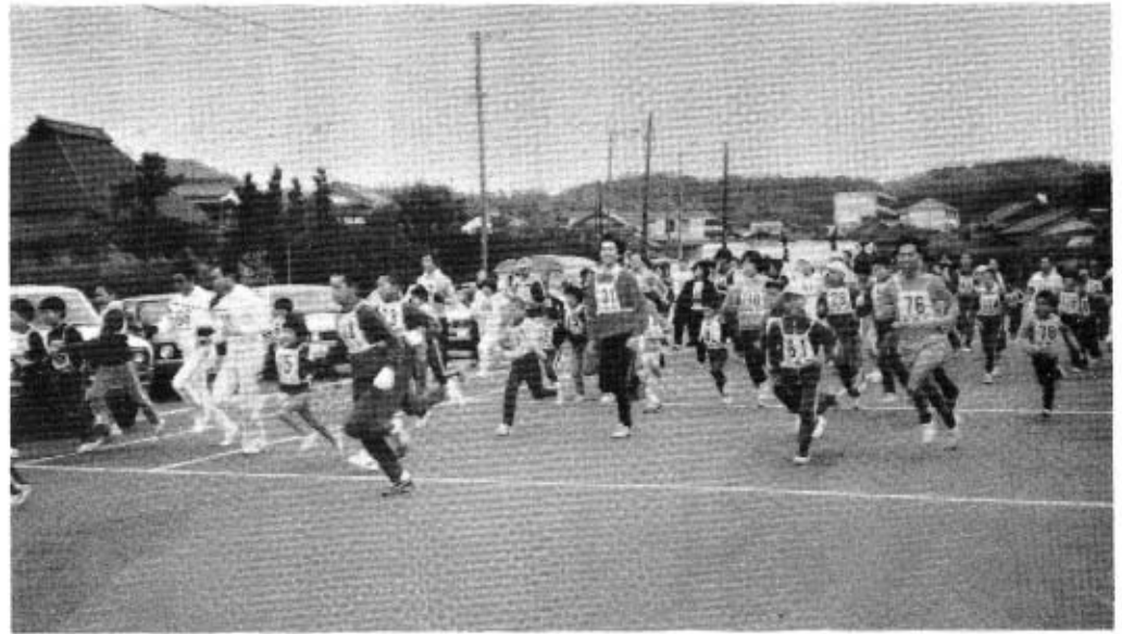
いっ齊にスタートする参加者の皆さん

新春恒例の正八幡宮参拝マラソン大会が、一月一日の午前八時から開催されました。 明るい陽光がふりそそぐ絶好のマラソン日和に恵まれ、幼児からお年寄りまで百二十人が参加し、開会式、準備運動のあと、中央公民館前をいっ齊にスタートし、折り返し点の正八幡宮へと向かいま