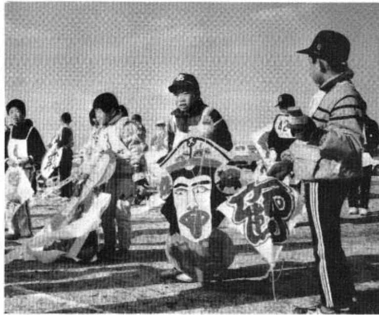
手作りのたこで出番を持つチビっ子たち

創意くふうにあふれた手作りのたこを新春の大空へ乱舞させ一年を力強く踏み出そう……と恒例の新春たこあげ大会が、一月九日(日)午前十時から祇園町埋め立て地で開催されました。大会には、たこづくり講習会や冬休みを利用して作った、色、形などに創意とくふうをこらした力作のたこを手に手に寒さに負けない、たくましい秋穂っ子が