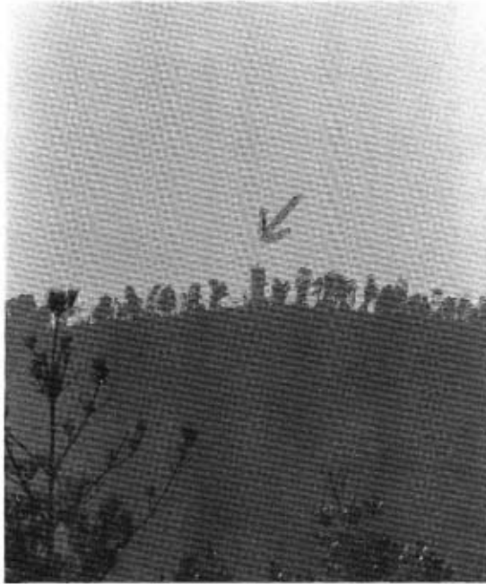
草山山頂に移設した新灯台

草山山頂に移転工事を進めていた新灯台が昨年の十二月十四日に完成し、同日二十日から新たな光を海面に送っています。 今まで以上に、付近を航行する船舶の海上安全に寄与することでしょう。 新灯台の概要 地上高 十二メートル 平均水面上 百二十八メートル 位置 草山崎 東径一三一度二分三三秒、北緯三三度五八分五三秒 光達距離 一一・一五海里(約四万一千六百七十メートル)