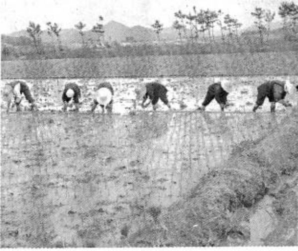
戦前の田植え風景

古くから米にはウルチ米とモチ米の二種があり、中世以降、早生・中生・晩生の種類ができ、水稲と陸稲の別があったが、秋穂地方では陸稲はほとんど作られていない。秋穂の米の品種については、明治十八年十一月、佐波郡宮市で米