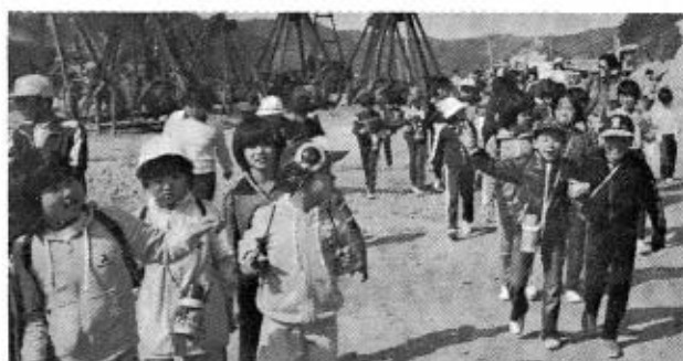
元気に歩くチビっ子たち

三月六日、小学校最後のハイキング大会。朝からよい天気にも恵まれ、大海支所を出発しました。 最初の目的地は、日地の石風呂です。ここで秋穂地区と合流しました。この石風呂は、秋穂町の有形民ぞく文化財に指定されているそうです。昔、塩田労働者やおとしよりの保養を目的に造られ、床にむしろなどをしきつめて入浴したそうです。 石風呂のことを説明された後、オーストラリアからはるばるこ