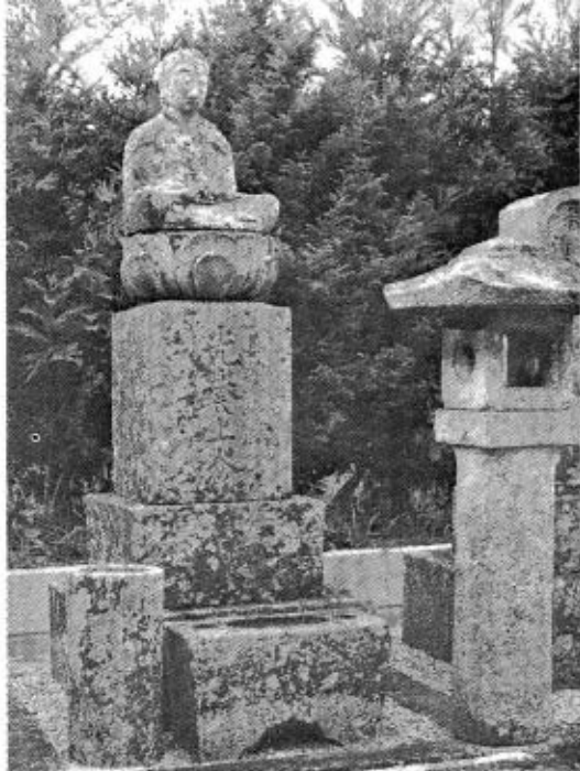
光誉法岸上人の墓 大道且墓地