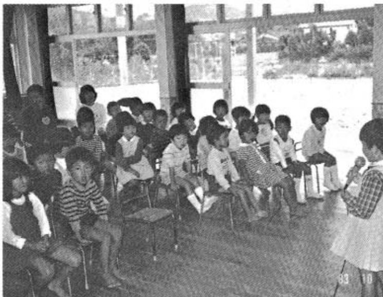
東幼稚園の園児たち