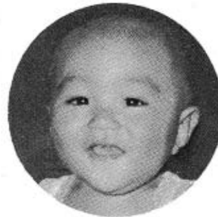
中野・秋重一豊さんの