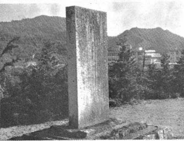
松永周甫記念碑 (後方は養学校)

その後かつての禿山も次第に緑化し、広い地所を所有していた松永家の当主祥甫氏がその土地を提供して養学校を誘置。次いで松光園、特別養護老人ホーム梅光苑もでき福祉の緑地となったが、その