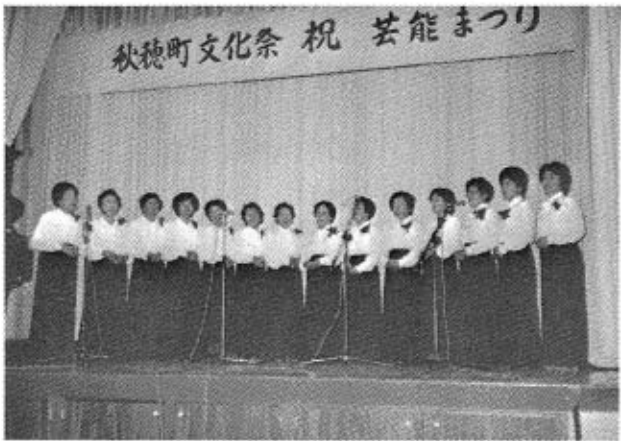
詩吟教室の皆さん