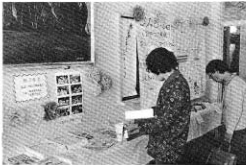
文化祭での展示も活動の一つです

「役に立つことだらけ。うちにはよく訪問販売が来ますが、私は断わり方が上手ですよ。無駄なお金を使わず、いいものより分ける目ができますね」と学級生のかたは、学級での成果を語っていました。