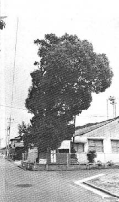
御茶屋跡(小郡町津市)

この御用船一艘は文久二年に臨時に造り替えられ、従来のものより大きくなり、長さ四間三尺、横一間余、総松材で新調された。その代米六斗九升余、銭六百八十二匁余、併せて米にして五石三斗三升であつた。