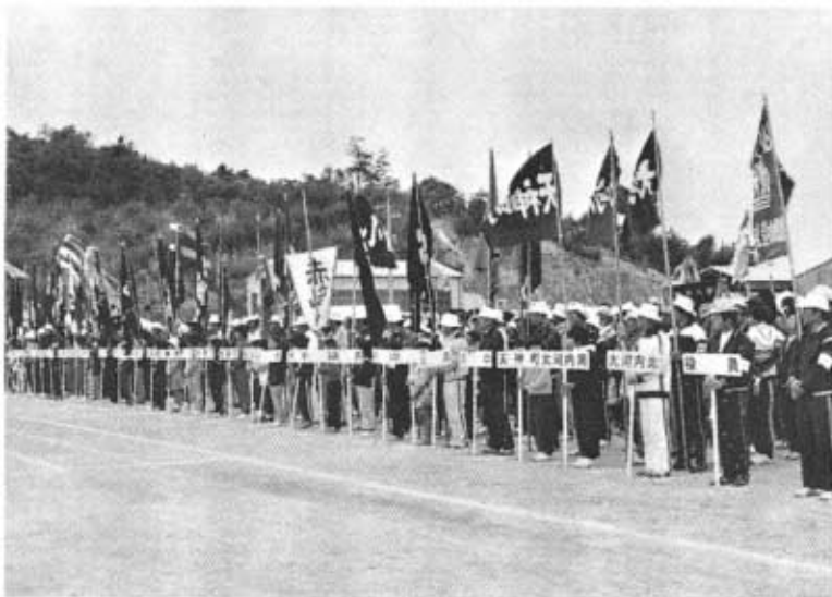
昨年の大会での開会式の様子

老若男女、だれもが参加でき楽しめる種目をたくさん準備しています。たくさんのかたがたがご参加くださって、暖かい春の一日を楽しく過ごしていただきたいと思ひます。 種目等の大会要項は、後日、社会体育推進委員のかたを通じてお知らせします。 なお、町民大会についてのお願いやご要望などありましたら、公民館へご連絡ください。