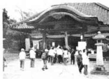
にぎわう1番大師寺

▼八十一番花香南大師堂 もと向山三神社に置かれていた。ここには首なし地藏尊があり、子どもの首から上の病にきくといわれる。 ▼八十八番宮の且大師堂 最後の札所。子宝、安産のお守り観音である。