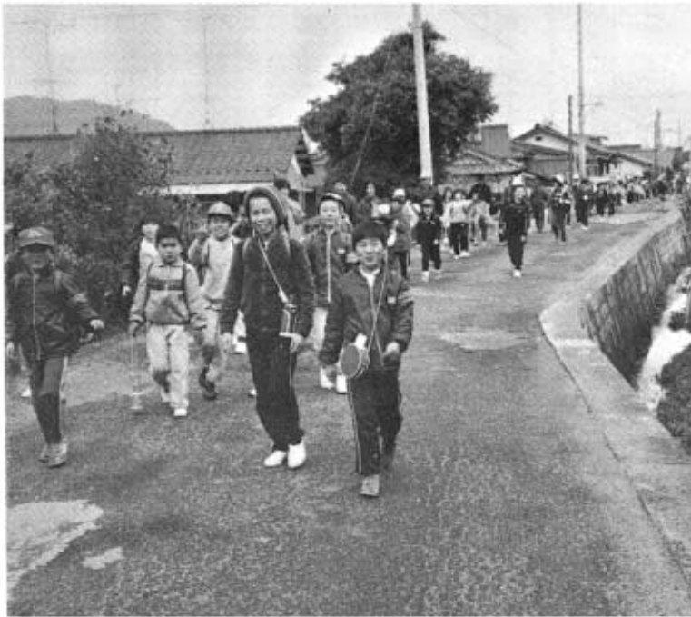
すばらしい我が郷土「秋穂」を再確認した一日でした