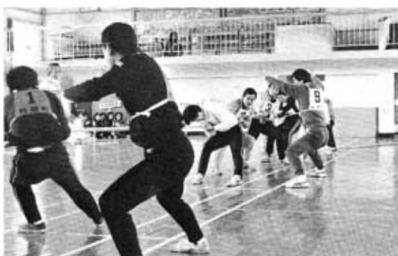
微妙な駆け引きで……

公民館学級教室は、生涯教育や温かいふるさとづくりの場として、あなたの知性を高め、情操を豊かにし、健康で明るい町を築く広場です。 「いつでも、どこでも、だれでも」学習活動ができるようにと、種々の学級・教室を開設しています。 お手元に昭和六十年年度公民館学級・教室のご案内が届いていると思います。ご家族やお友達と誘い合って多数ご参加ください。 申し込み期限は四月二十日(土)です。多くのかたがたの参加をお待ちしています。