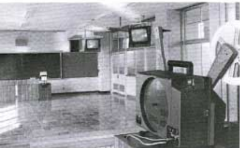
近代的設備のととのった視聴覚教室

第四点 「情の教育の推進」最近の子どもの心はカサカサに乾いています。「情の教育」を強力に推進し、「暖かい町、潤いのある町秋穂」づくりに寄与したいと思っております。 「高き理想に光あれ(校歌)」何とぞ倍旧のご理解、ご支援を賜りますよう、心からお願いいたします。