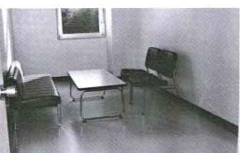
生徒のカウンセリングを行う相談室