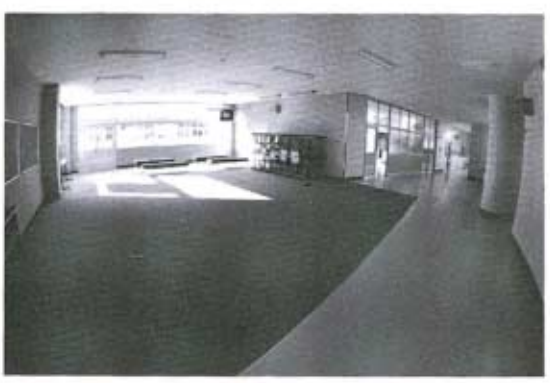
いろいろな用途に使われる多目的スペース