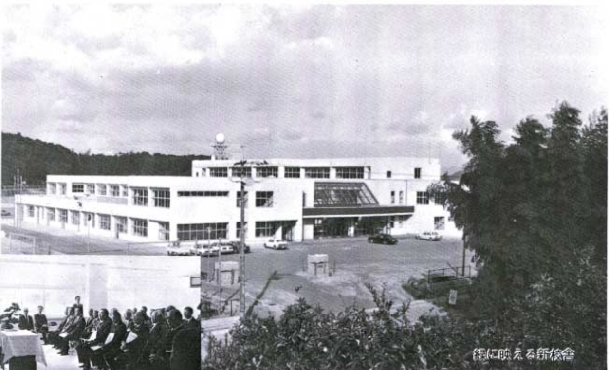
緑に映える新校舎