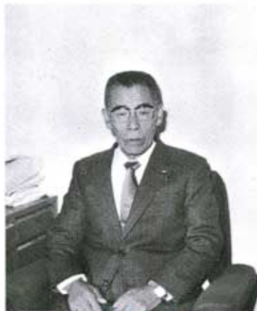
町民の生活向上に 献身努力を

なにとぞ、従来に変わらぬいご指導とご協力を賜りますようお願いを申し上げます。町民各位のご健勝とご多幸をお祈りしまして、年頭のごあいさつといたします。