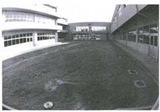
生徒のふれあいの場、また朝礼などに使われる中庭