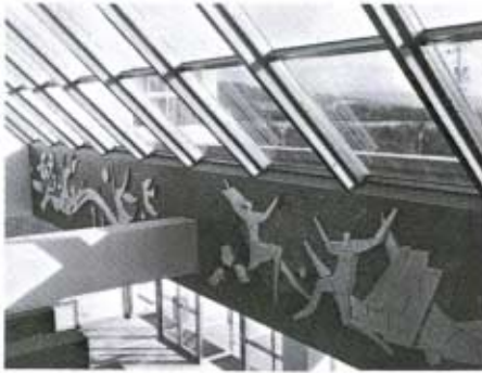
「飛躍」を描いた壁画

なお、体育館は六十一年度中には完成する予定で、面積は延べ一四九三平方メートルで計画されています。