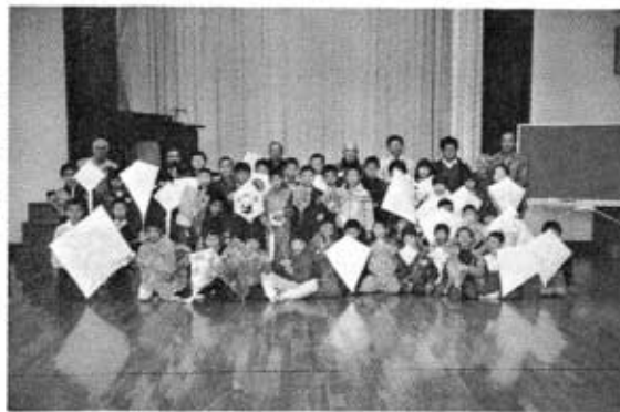
▶講習会に参加した皆さん