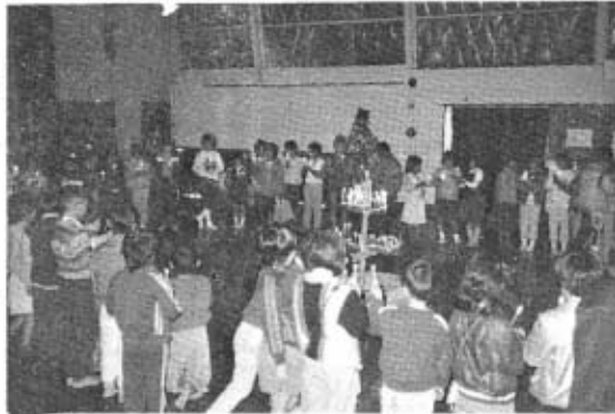
盛会だったクリスマスパーティー

ちと仲よくなりたいたいと考えています。また、子どもでも大人でもない彼らはその特性を生かして、チビっ子たちの悩みなどをいっしょになって考えてみたいとも思っています。 そして、親が全て決めるのではなく子どもたちが自分で作る「子ども会」にするためのお手伝いをしたい。行事をする時などは計画の段階からどんどんと声をかけて欲しい、と考えています。 青春をひたむきに生きる彼らに、拍手を送ろうではありませんか。