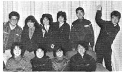
ゆかいな仲間たち