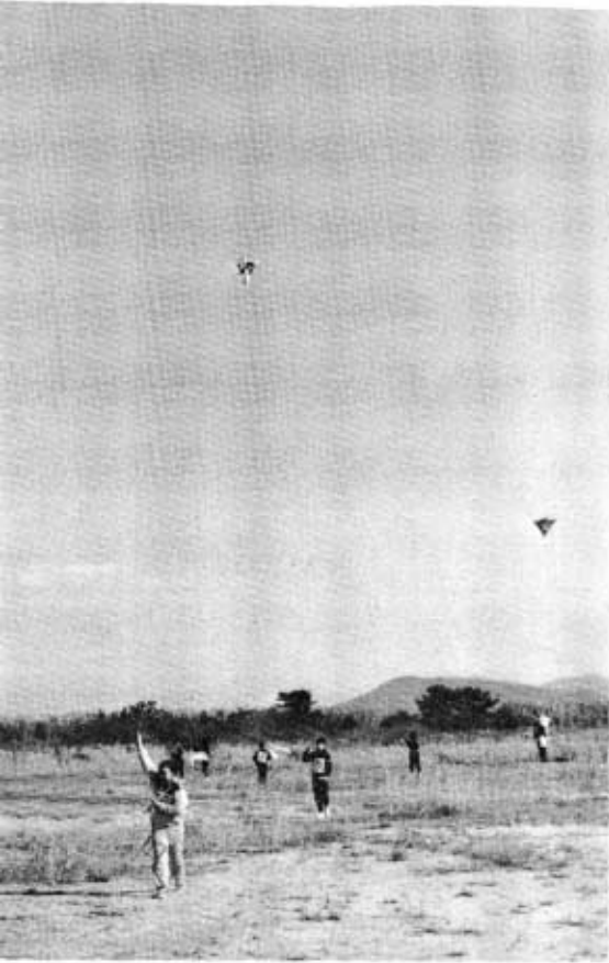
▲大空に高く舞いあがりました