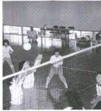
▶「バシッ」と強烈なスパイク