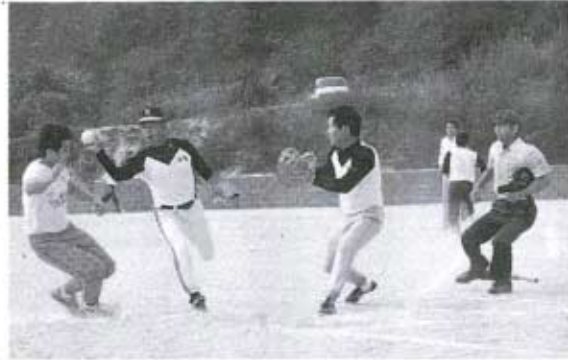
▶ホーム寸前「おっとっと...」