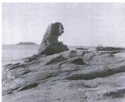
猿岩(花香山東側)の展望

明治十二年に、この大小区制は郡区町村制に改められた。よって、再び県内には弱小規模