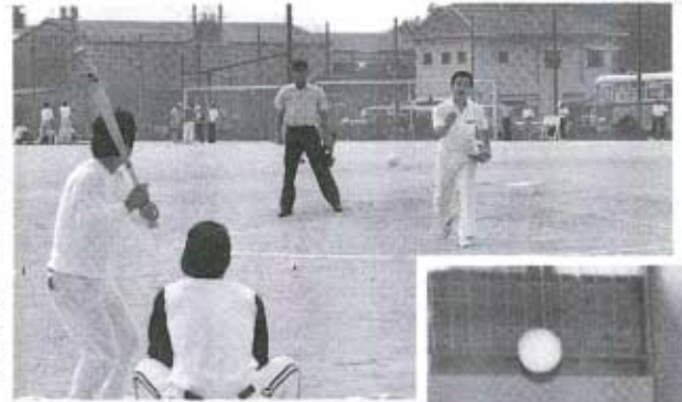
▶藤生町長の始球式で プレイボール