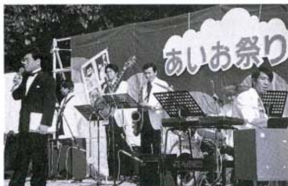
◀司会、バンドも汗びっしょり