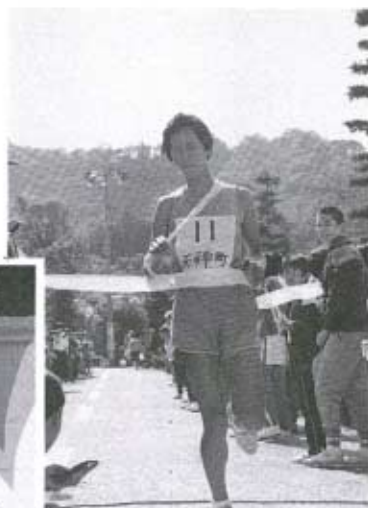
▲浜村杯一般の部は 天神町チームが優勝