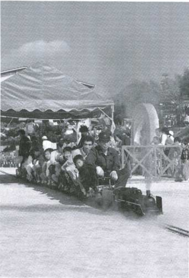
▲ミニSLはお父さんにも好評でした