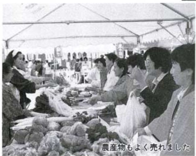
農産物もよく売れました