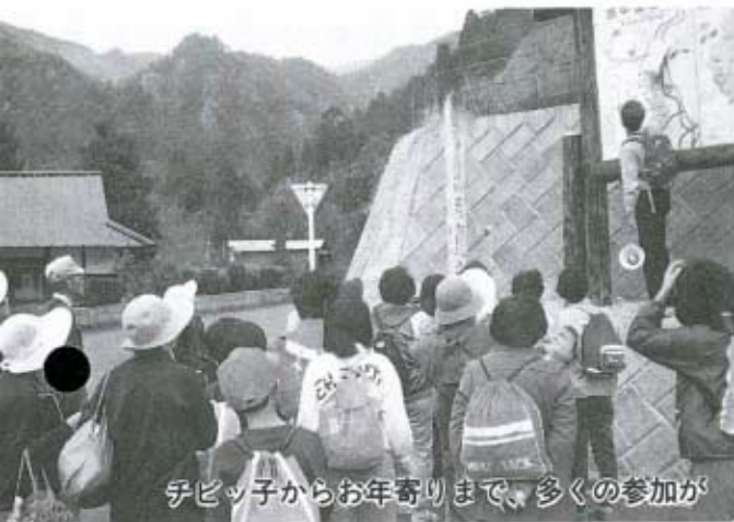
チビっ子からお年寄りまで、多くの参加が