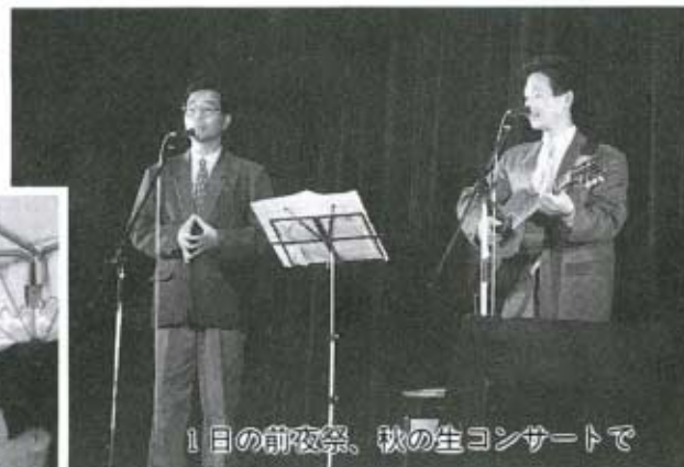
1日の前夜祭、秋の生コンサートで