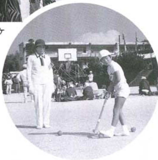
▶ゲートボールでふれあいました