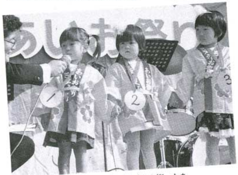
▲かわいかった“ミス桜”たち