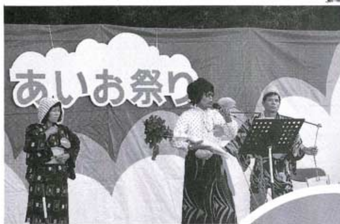
▲ほんとうに楽しかったカラオケ