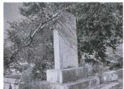
「榎野川改修記」碑(小郡町東津)