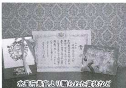
水産庁長官より贈られた賞状など

このように、秋穂漁協婦人部はいろんなテーマをもって、いつしようにけんめい活動しています。