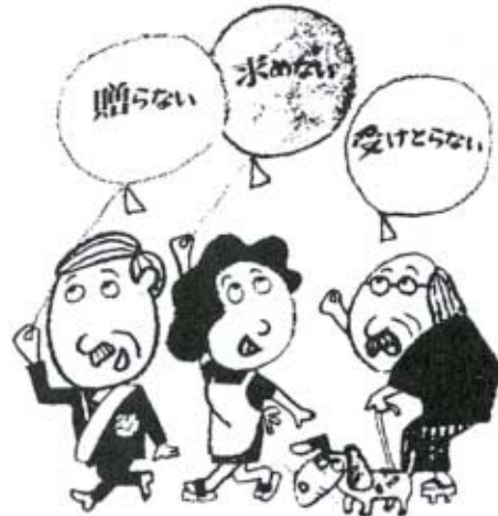
秋穂町明るい選挙推進協議会