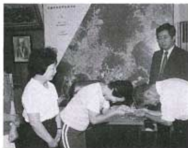
ボランティア基金へ寄付を

七月二一日、今年も中道海水浴場をきれいにと、養護老人ホーム「秋楽園」と国際ソロプチミスト山口の皆さんが、中道海岸の清掃奉仕作業に汗を流されました。 この清掃奉仕作業は、秋楽園が三十年以上も毎年行われているもので、国際ソロプチミストの皆さんも、昨年に続いての参加です。 奉仕作業終了後、町長室を訪