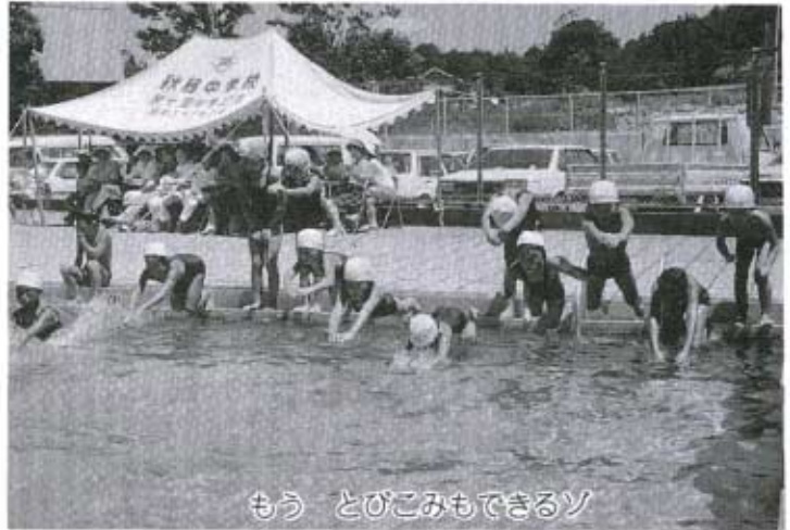
もう とびこみもできるゾ

八月五日から四日間、町民水泳プールで、初心者水泳講習会が開催されました。 今年天候が心配されましたが、百二十人の参加があり、山口県水泳連盟の有岡先生と山口大学水泳部の皆さんの、優しく、ときには厳しい指導を受けてめきめき上達しました。 最後の日には記録会も実施しましたが、五十メートル、百メートル泳いだチビッコも多く、中では三百メートル泳ぎきった子もいて、みんなの拍手をあびてうれしそうです。