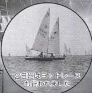
2日にはヨットレースも行われました