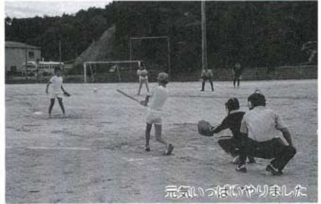
元氣いっぱいやりました

日時 九月六日(日) 午前 八時開会式、八時三十分試合 開始 種目 男子ソフトボール 女子バレーボール 男子秋中グラウンド 女子秋中体育館 ※当日が雨天の場合は、男子は秋穂小体育館で、綱引きを行います。