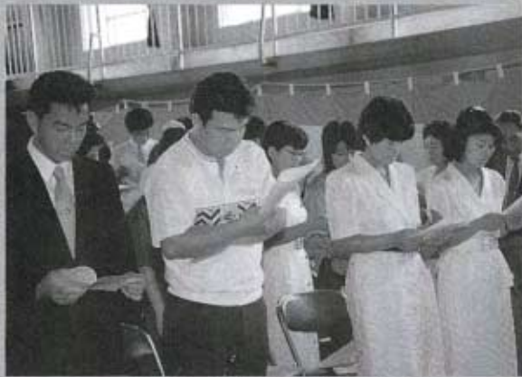
▲町民憲章を読みあげる成人