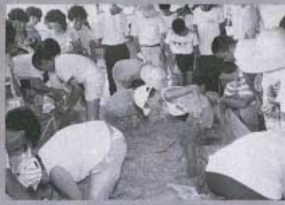
大好評でした “あなごのつかみどり”