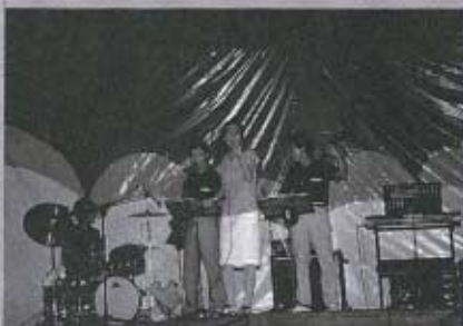
おなじみ「ジャストジャズカルテットのジャズ演奏