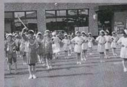
秋小児童による鼓笛隊とバントワラーがパレード