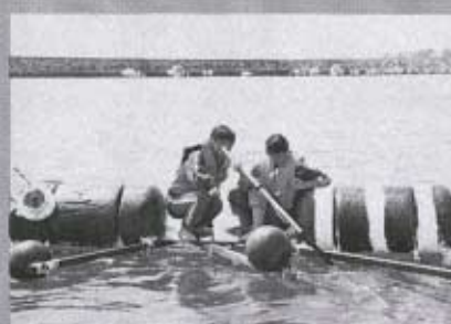
“それ行けイカダ” アイディアの部の優勝は黒潟南子ども会