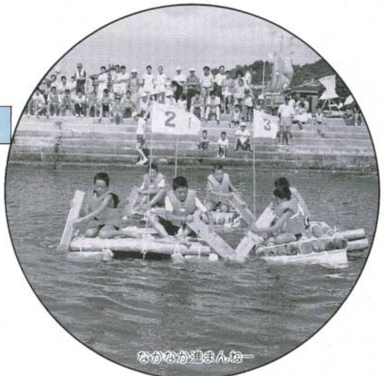
なかなか進まんねー