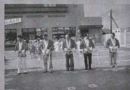
テープカットでオープニング