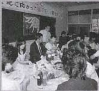
パーティー会場では懐かしい話に華が咲きました