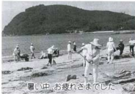
暑い中、お疲れさまでした

品種とします。 配布時期 昭和六十二年十一月から昭和六三年三月三十一日までの希望の日とします。 申込受付期間 九月一日から九月三十日まで 配布決定 植付場所を調査検討のうえ決定し、その旨を申込者に通知します。 ただし、数量に制限がある場合がございます。 申込先・詳細 町役場産業課 ※申込用紙は、すでに各区長さんあてに送付してありますので、申し込みは、必ず区長さんを通じてするようにしてください。