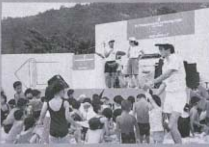
2日のヨットレースにはたくさんの人が集まりました