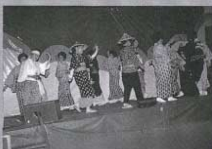
民謡同好会の民謡大会