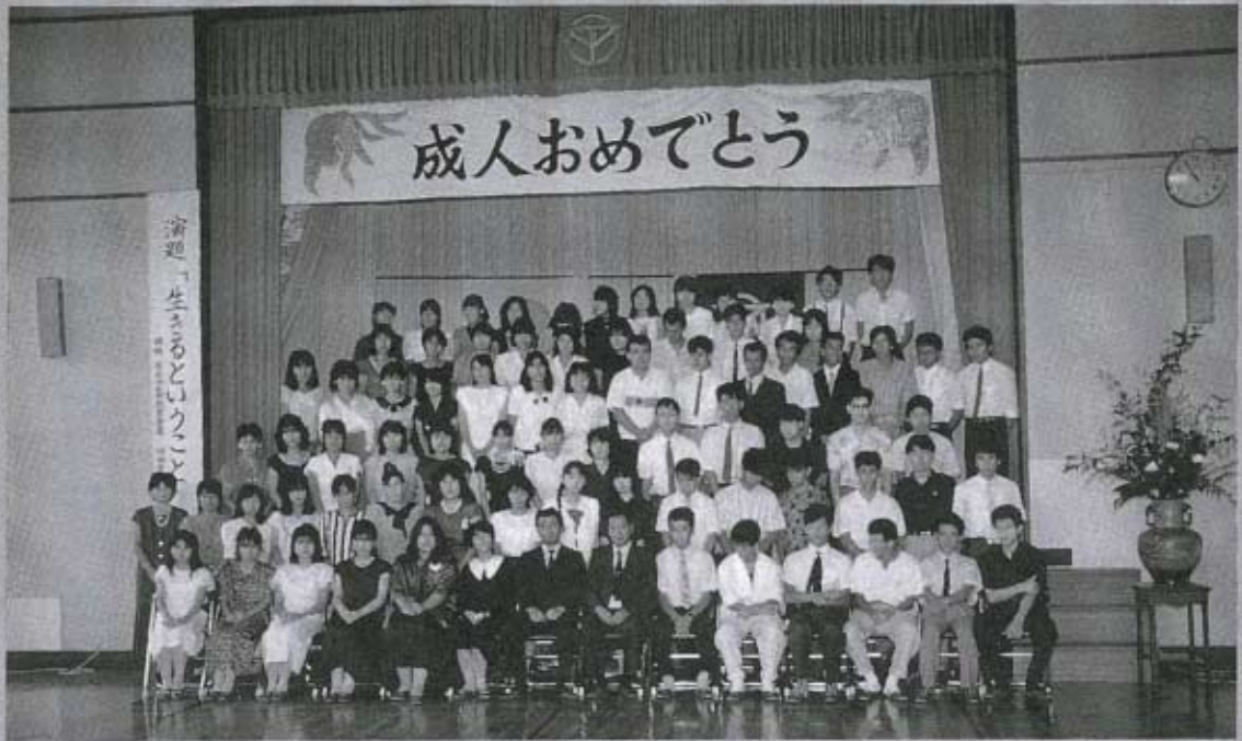
▲全員で記念撮影……の10秒前