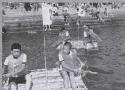
それゆけイカダ レースの部「いっしょうけんめいごきました」