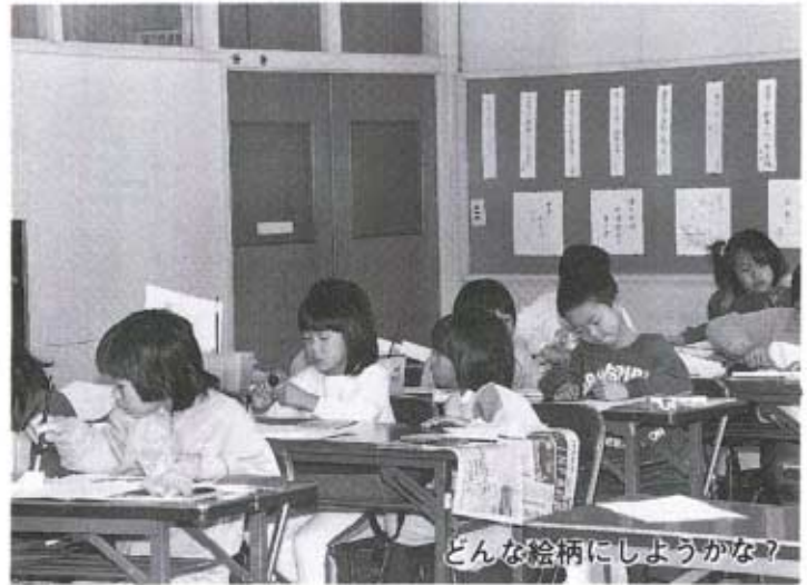
どんな絵柄にしようかな?