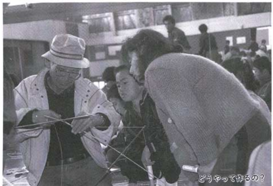
どうやって作るの?

十二月二十日(日)、中央公民館で、伝承グループの皆さんの指導により、「たこづくり講習会」を開催しました。親子づれなど、六十人の参加で、思い思いのたこづくりに挑戦しました。一月十五日(成人の日)の「たこあげ大会」が楽しみです。