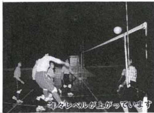
年々レベルが上がっています

家庭男子・婦人 バレーボール大会 十二月六日(日)男子四チーム、女子八チームが参加し、家庭男子・婦人のバレーボール大会が、秋穂中学校体育館で開催されました。 成績は次のとおりです。 ■男子の部 優勝 三邦ファミリーチーム 準優勝 町役場チーム ■女子の部 優勝 秋穂クラブチーム 準優勝 こぶしクラブチーム