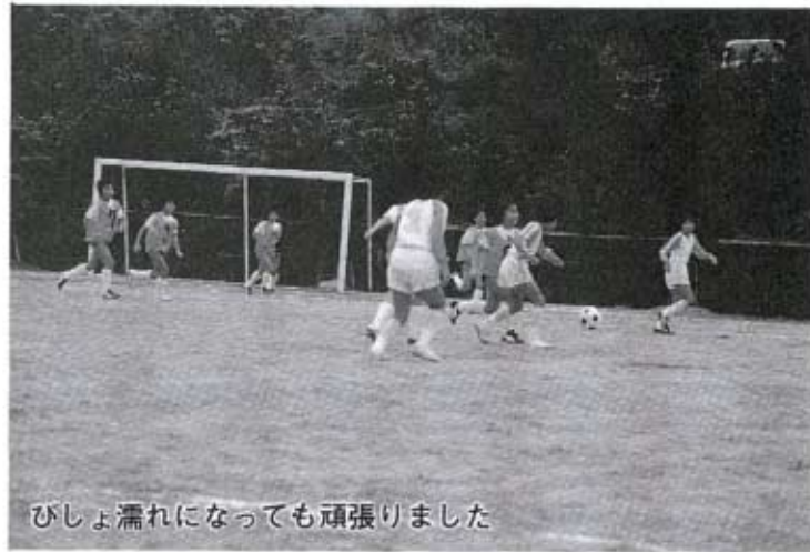
びしょ濡れになっても頑張りました