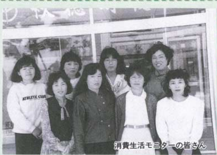
消費生活モニターの皆さん