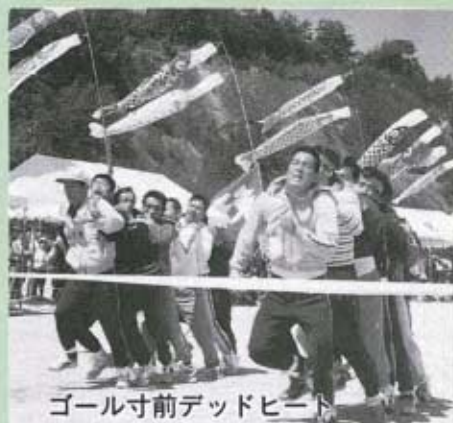
ゴール寸前デッドヒート