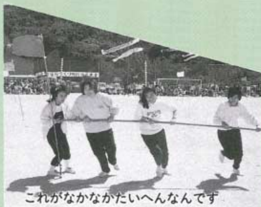
これがなかなかたいへんなんです