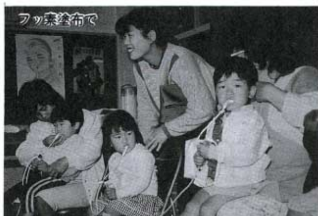
歯がだいじ食べる楽しみいつまでも