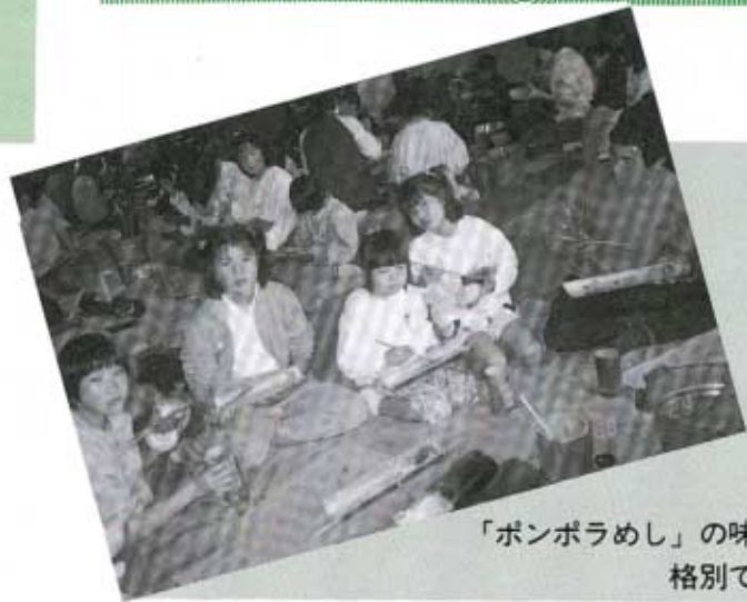
「ボンボラめし」の味は格別です

恒例の石城山家族のつどい大会を四月二十九日(天皇誕生日)に大和町の石城山青少年宿泊訓練所で行いました。 当日は、雨天であるにもかかわらず百三十人の参加があり、バス二台に分乗して出発しました。 ボンボラ炊飯やオリエンテーリングなどを通して、親子のふれあいを深めることができました。この日の様子を作文で紹介します。