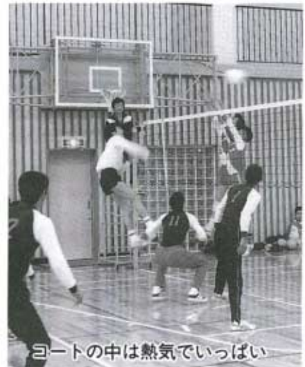
コートの中は熱気でいっぱい