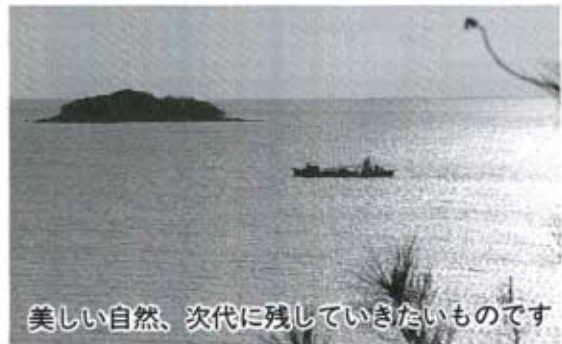
美しい自然、次代に残していきたいものです

わたしたち人間が健康で快適な生活を送るためには、きれいな空気や水などの自然をはじめとする豊かな環境が不可欠です。そのためには、わたしたちを取り巻く環境を、ふだんから守り育てていく努力が必要です。