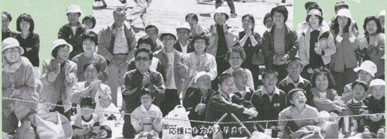
応援にも力が入ります