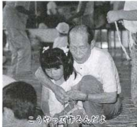
こうやって作るんだよ