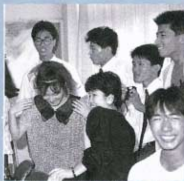
▲懐しさに、同窓会のノリ▼

110人の参加のあった今年の成人式。式典が行われた講堂も、パーティ会場も、押すな押すなの超満員。近年まれに見るにぎやかな成人式でした。