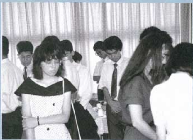
▶終戦記念日のこの日の正午、全員で黙とう