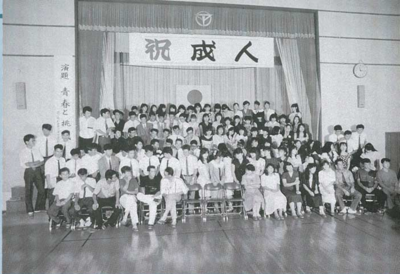
▶これから、全員で記念撮影