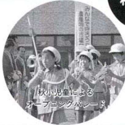
秋小児童による オープニングパレード

八月六日と七日の二日間、夏の祭典「サマーフェスティバル」が、六日は秋穂漁港、七日は中道海岸で、昨年にも増してにぎやかに行われました。 この祭りの様子を、写真でお伝えします。