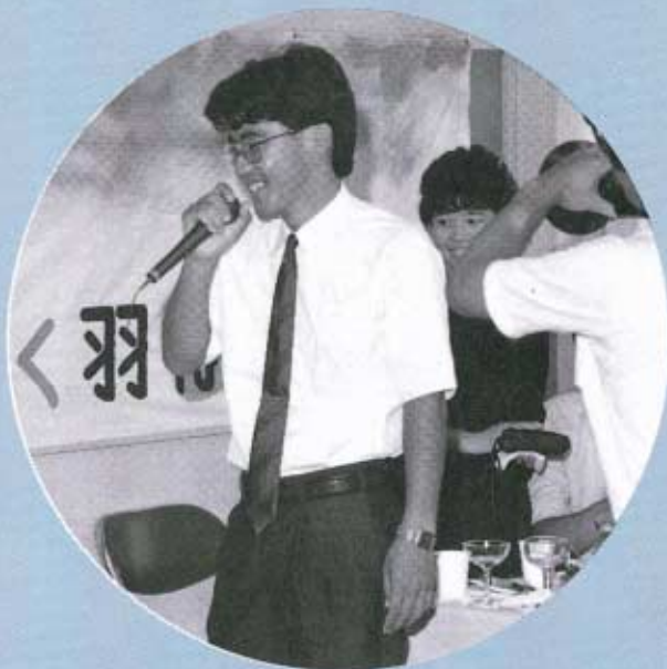
▲最後には歌まで飛び出しました

110人の参加のあった今年の成人式。式典が行われた講堂も、パーティ会場も、押すな押すなの超満員。近年まれに見るにぎやかな成人式でした。