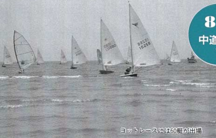
ヨットレースには60艇が出場