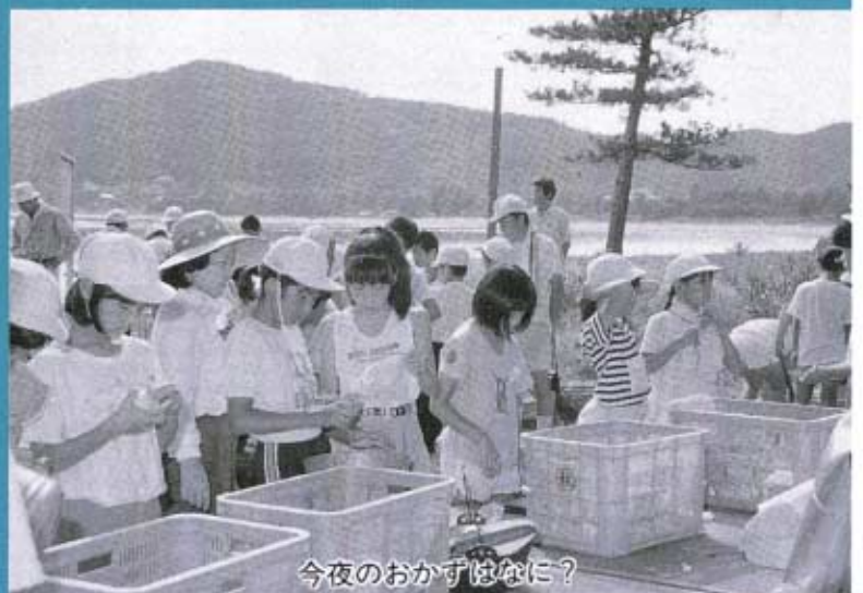
今夜のおかずはなに？

七月二十一日・二十二日の二日間、吉敷郡三町の子ども会の子どもたちが、キャンプで団体生活をしながら交歓をしようという目的で集まり、今年には中道のセントラル硝子保養所で実施しました。この二日間には、子ども会の会員が七十人、指導者を含めた育成者三十人、合計百人の参加がありました。一日目の夕食には、この日