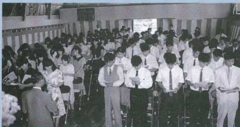
▲町民憲章を読みあげる成人