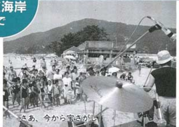
さあ、今から宝さがし