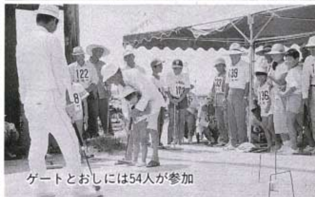
ゲートとおしには54人が参加