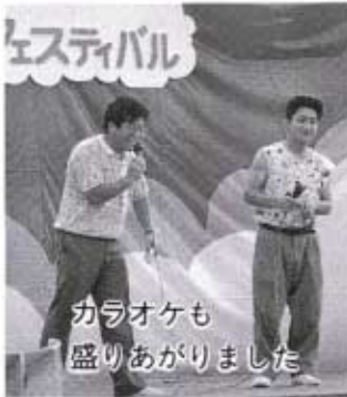
カラオケも 盛りあがりました