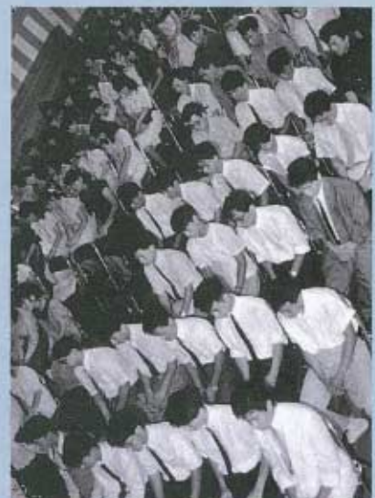
▶当日は、 百十人が出席