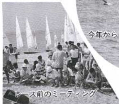
レース前のミーティング

交通事故統計によると、秋穂町内で起きた交通事故による死者は、千八百二十八日間出ていません。(六月末現在)これは県下の五番目に長い記録で、これをたたえ、七月二十九日、交通安全協会秋穂支部が小郡警察署長と小郡交通安全協会会長より表彰を受けました。 これからも一人ひとりが自覚し、交通事故のない秋穂町を継続しましょう。