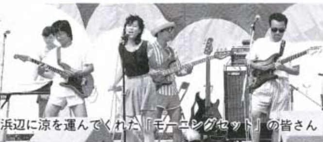
浜辺に涼を運んでくれた「モーニングセット」の皆さん