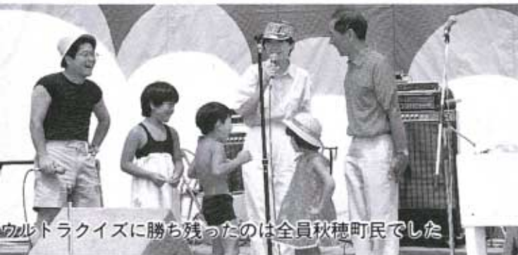
ウルトラクイズに勝ち残ったのは全員秋穂町民でした