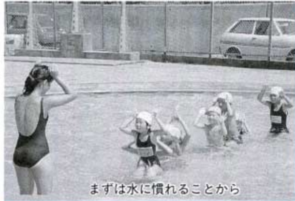
まずは水に慣れることから

七月二十七日（水）伝承教室わらざうりづくりが、中央公民館の講堂で行われました。今年には七十人の参加があり、伝承グループの七人の先生方の指導を熱心に受け、わらざうりを作りあげていました。