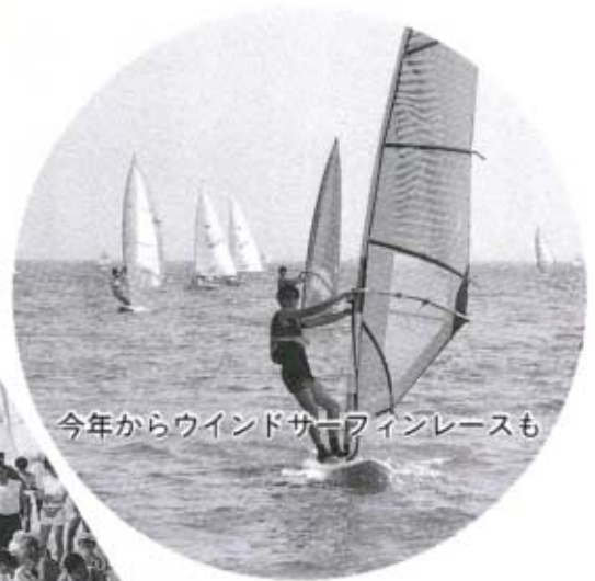
今年からウインドサーフィンレースも