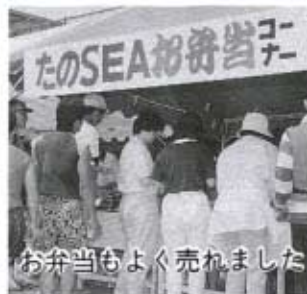
お弁当もよく売れました