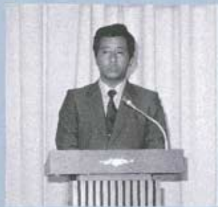
▶成人に励ましの言葉 を贈る藤生町長