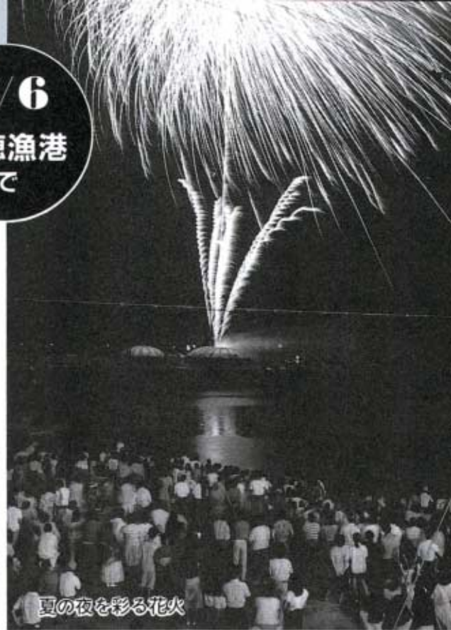
夏の夜を彩る花火