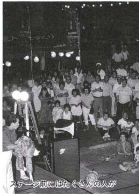
ステージ前にはたくさんの人が