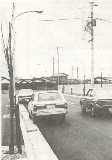
ニセアカシヤの街路樹の植栽を終え完成した東山通り下矢原線

昨年十月から工事を進めていた、山口都市計画道路「東山通り下矢原線」の一部が、このほど完成しました。