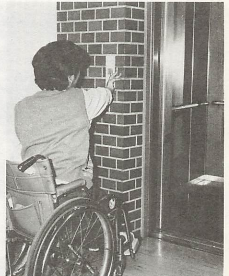
身障者にも楽に利用できるボタンが設置されているエレベーター（県福祉会館で）

注 ◎印は、整備を特に必要とするもの ○印は、整備を必要とするもの △印は、整備されることが望ましいもの