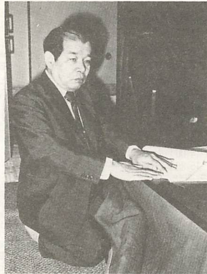
点字市報発行10年目にあたり、感慨深げに創刊号を手にする汐見会長

数月三百部、四十九年七月から始めた徳山市が百六号（二十三ページ・同百部）、同年十月から始めた宇部市が百一十号（二十九