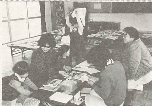
親子連れでにぎわう開館日。貸し出しは1人4冊まで

宮野下恋路県営住宅集会所に開設されている「みやの子ども文庫」は、毎週土曜日の午後一時三十分から三時まで、図書貸し出しが行われ、町内の児童やお母さんがたでにぎわっています。開設されて三年目を迎える同子ども文庫を訪問し、活動状況や今後の抱負を聞いてみました。