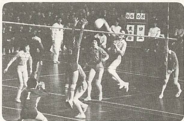
▲一流のプレーで、4,000人を魅了

2月5日、県体育館で「全日本バレーボールリーグ山口大会」が開かれ、一人時間差やクイック攻撃など一流選手による多彩な技で、4,000人の観客を魅了しました。