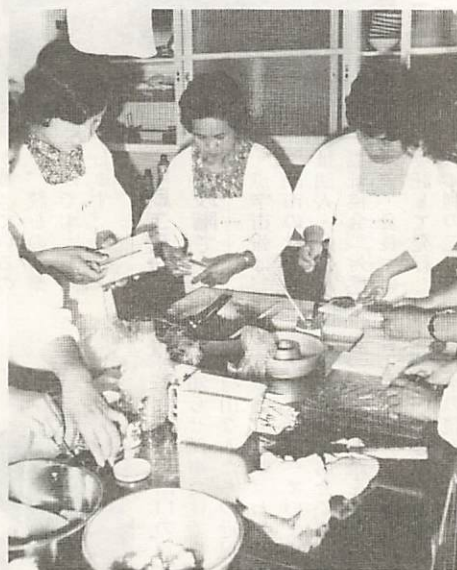
料理教室で、健康づくりに積極的に取り組む婦人

この中では、努力しよう、これからの福祉」と題して、六つの分野の努力目標を掲げ、心豊かな福祉のまちづくりをめざしています。