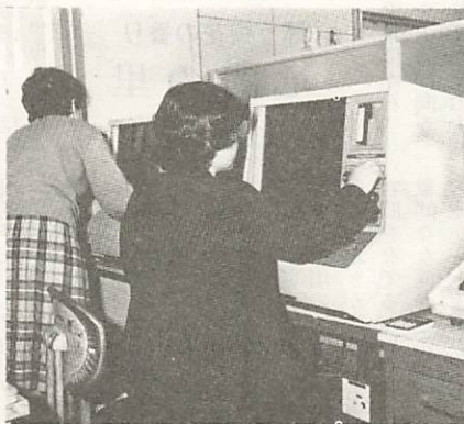
マイクロフィルム化した徴収台帳で、納税状況を確認する職員

市民のみなさんから納めていただいている市民税、固定資産税、軽自動車税等の市税は、道路や公園、下水道の整備、学校教育及び福祉施設の充実等、市民生活に密接した事業に使われています。こうした事業には多大な経費を要し、税金に大きく左右されます。そこで納税課職員は、市財源確保のため毎日心血を注いでいます。 市庁舎の二階で、一番南側にある納税課は、管理係、納税第一係、納税第二係に分かれ、課長以下十六人の職員が勤務しています。 課の仕事は、納められた市税及び国民健康保険料の収納整理、納め過ぎの方への還付処理、未納の方への督促状、催告状の発行、さらには未納者の実態調査、及び滞納処分等です。収納整理にあたっては、昭和四十八年から逐次コンピュータを利用して事務改善を計ってきました。なかでも、五十三年から課税件数の多い固定資産、市民、軽自動車の各税について、台帳をマイクロフィルム化して保存する方