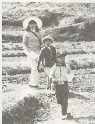
時間と決められたポイントを正確に回ることを競う競技(写真は、昨年の大会)

市教育委員会と市オリエンテリングクラブとの主催で「第十回市オリエンテリング大会」を、次により開催します。 雨天でも決行します。 日時 三月二十七日(日) 受付時間は午前九時～十一時 ■集合場所 宮野小学校 ■競技形式 ポイントO.L ■クラス (個人) 性別、年齢や経験回数により十クラスに分けて行います。(トリー