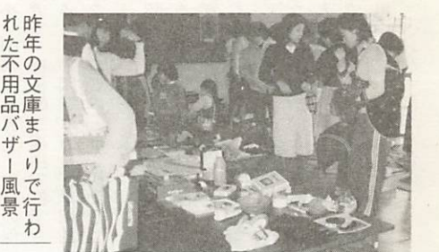
昨年の文庫まつりで行われた不用品バザー風景