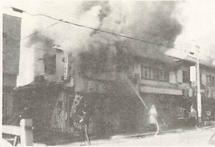
こわい商店街の火災（写真は一月二十八日の出火）