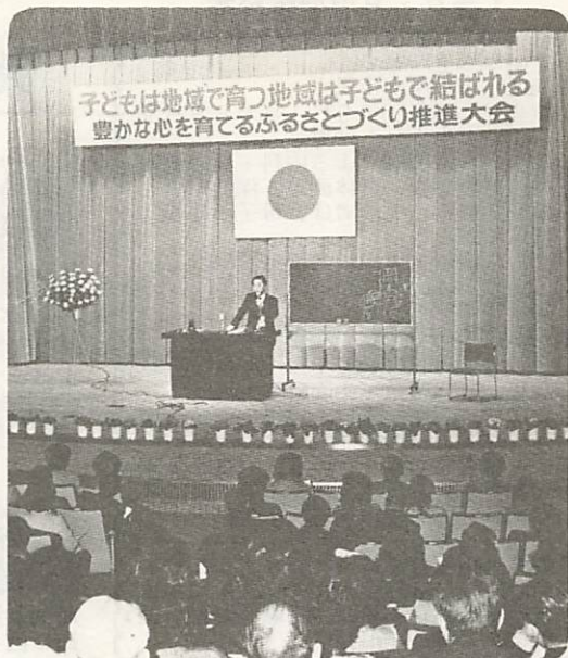
▲推進大会、シンポジウムや講演に500人

吐く息も一段と白く 二月二日からパドミントン講習会が始まり、みほり学園体育館に、五十人余りの初心者が集って来ます。午後八時から二時間の練習で、受講者の吐く息が、一段と白く見えていました。