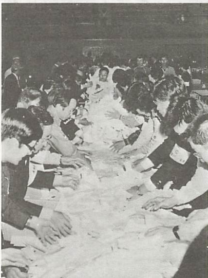
正確に記され、迅速に開票事務は、進行められます。(写真は4月24日に開票風景) われた市議会議員選挙の