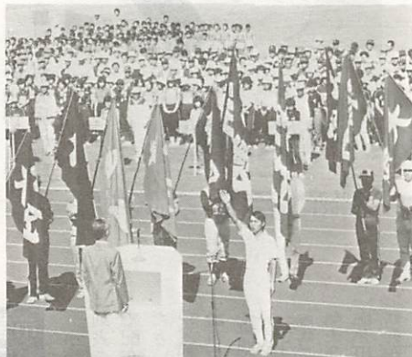
声高らかに宣誓をする選手代表。鴻南の秋空に元気な声が響き渡ります(昨年の大会)

市民のスポーツの祭典、第二十回市民体育大会を次のとおり行います。地区の榮譽を担う選手に、地区ぐるみで、温かい