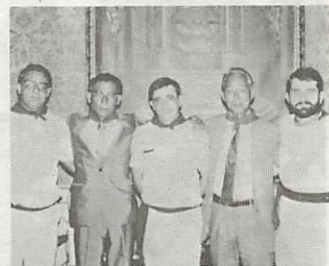
バンブローナ市役所市長応接室での公式訪問。中央は本市市長秘書役。両端は、本市市議会議員

サンフェルミン(牛追い)祭に合わせ、スペイン国バンブローナ市を訪問した山口市姉妹都市市民の会(一行十四人)は、七月十一日、本市に到着し三日間にわたり、市民サイドによる交流を深めました。また、七月十二日には、バンブローナ市役所を訪問し、市長秘書役・市議会議員(二人)、渉外担当職員との懇談を行い、街路樹の分譲を申し込み、本市側からは、鯉を譲り受けた旨の要望がありました。一行は、十二日、祭を満喫し、翌十三日朝、マドリッドに向いましたが、本市の印象は、各地の公園広場に、例外なく、建立されている歴史的人物の銅像や彫刻の醸し出す歴史的雰囲気であったようです。