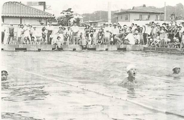
◀ 声援のなか、選手たちの力泳 八月二十一日、平川地区では水泳大会が小学校のプールで開かれた。会場には五百人がつめかけ、力泳する選手に盛んに声援を送っていた。