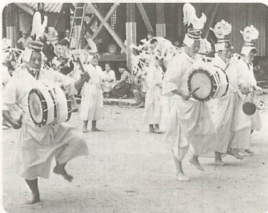
▶ 古式豊かに、腰輪踊りの奉納 陶地区郷上の八雲神社では八月二十八日、恒例の風鎮祭が行われた。神事に続き、四百年の伝統をもつ無形民俗文化財指定の「腰輪踊り」が奉納された。