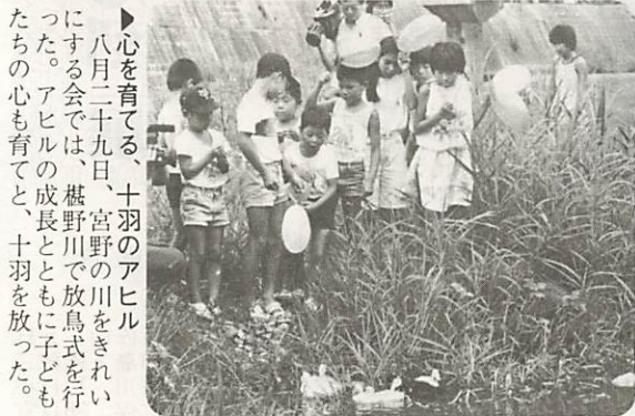
▶ 心を育てる、十羽のアヒル 八月二十九日、宮野の川をきれいにする会では、榎野川で放鳥式を行った。アヒルの成長とともに子どもたちの心も育てと、十羽を放った。