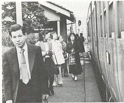
無人化が計画されている大歳駅。住宅建設が進み、今後利用客の増加が期待されます