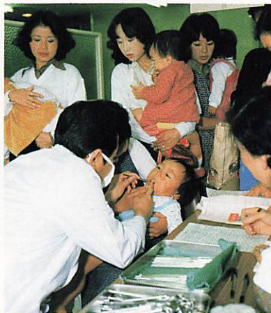
1歳6ヵ月児健康診査などの会場として市民に親しまれていた市民ホール。9月まで、衛生課の事務所として使用します

健康相談・健康診査 1月から場所が変わります 昨年十二月下旬より、市庁舎増改築工事が始まり、議会棟一階の市民ホールは、衛生課の事務室となりました。 このため、市民ホールで実施しておりました、毎週月曜日の健康相談(乳幼児・一般)並びに一歳六ヵ月児健康診査(北部地区)は、一月から次のとおり場所が変更になります。