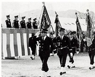
昨年の市消防出初式 (観閲)