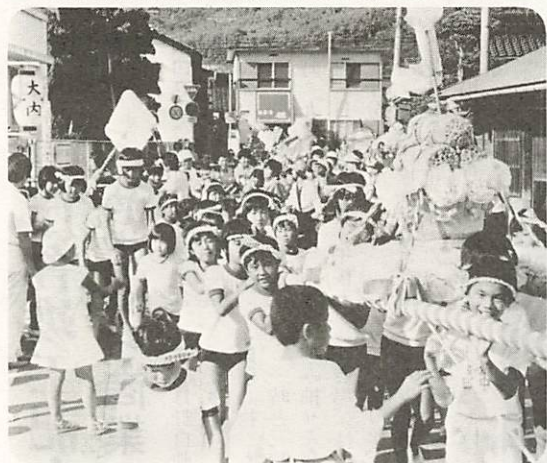
△にぎわった、大内子ども会フェスティバル

青少年の健全育成を願って、「大内子ども会フェスティバル」が8月18日、公民館で開かれた。手づくりみこしコンクールや親子歌合戦、盆踊り大会などの催し物に、家族連れなど多くの人出でにぎわった。