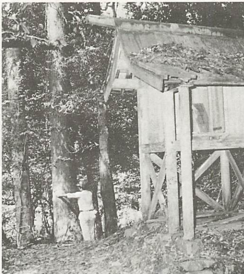
シラカシやツクバネガシなどの老木が茂る山神社跡一帯