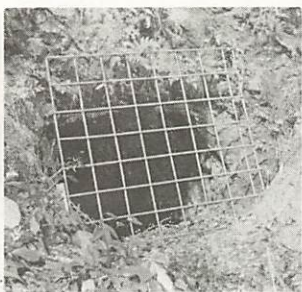
一の坂銀山の名残りをとどめる「甚内マップ(鉱穴)」

つたといわれ、二十数か所が発見されています。銀鉱精練のカラミ(鉱滓)の跡も出土しており、一帯には呉服峠、八百屋町、魚屋町などの地名もあり、労働者は四千人〜五千人いたといわれます。また、萩往還は、銀山開発の交通路でもありました。