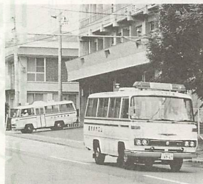
緊急出動する救急車。昨年1年間の出動は2,538回、現場までの平均到着時間は5分～10分です

○ 休日や夜間の急病は、落ちついてホームドクターや当番医に相談する。 ○ 新聞、広報紙などで休日当番医を確かめておく。