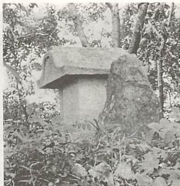
兄弟山の一方、兄山の頂。湯田のまちが眼下に見渡せます

この事業は、都市周辺及び近郊地域に保健機能と合わせ、国土保全機能を総合的に発揮できる森林を治山事業として造成、改良し、市民生活