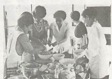
成人病予防食の講習会

在宅障害者のためのデイ・サービス事業を実施します。申し込みは、いずれもしらさぎ会館(堂の前町1-5 ☎22-3666)です。