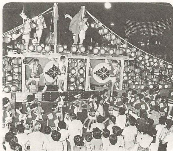
△揺れ動く熱気、商店街は光のアーチ

青少年の健全育成を願って、「大内子ども会フェスティバル」が8月18日、公民館で開かれた。手づくりみこしコンクールや親子歌合戦、盆踊り大会などの催し物に、家族連れなど多くの人出でにぎわった。