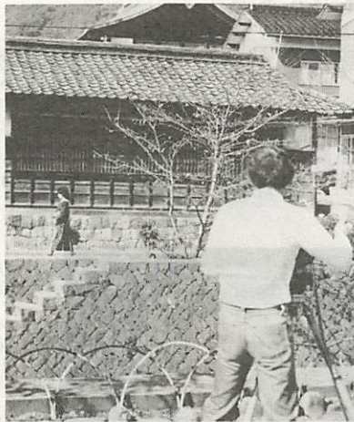
一の坂川で行われた撮影風景。このほか五重塔、雪舟庭、SL運行なども紹介されます

「歴史とロマンの街」として観光客に人気のある山口市。八月から九月にかけて、NHK、関西テレビ、日本交通公社の録画撮りが市内の観光地で行われ、テレビや十六ミリフィルムで山口の観光地が全国に紹介されることになりました。 NHKでは、十月一日から一か月間毎日放映されている「番