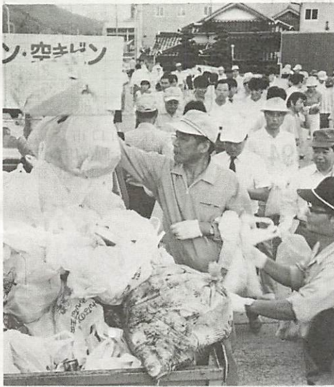
9月22日、国道9号宮野地区での空き缶等の一斉回収。この日は、地区の人たち、関係団体など370人が参加しました

一年間に、わが国でつくられるジュース、ビールなどの飲料缶は、なんと百億個。スチール缶、アルミ缶、スチールとアルミの混合缶の三種類ですが、こ