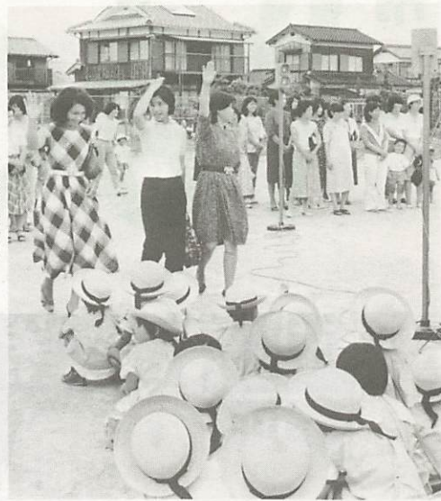
車はすぐには止まりません (写真は昨年6月に行われた平川幼稚園での親子交通安全教室)