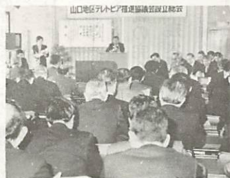
テレトピア推進協議会設立総会

二月七日、山口・防府・小郡の各商工会議所会頭を發起人とする「山口地区テレトピア推進協議会」(会長八木宗