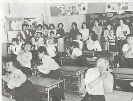
楽しい学校生活 (昨年5月、名田島小で)