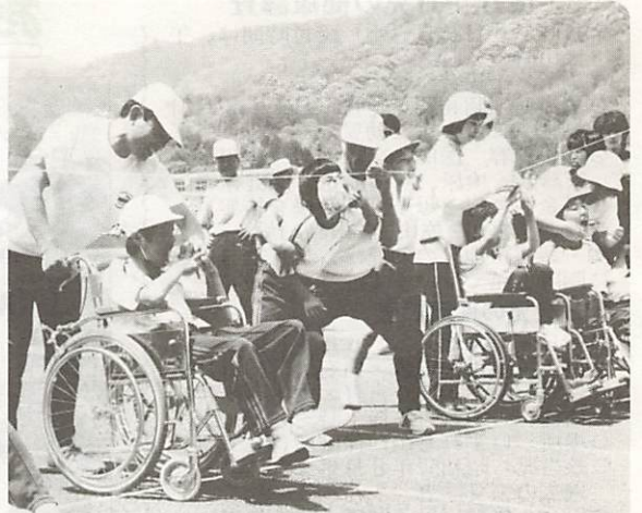
△五月晴れの下で、さわやかなふれあい 県アイリンピックが5月3日、維新公園陸上競技場で開かれた。児童福祉施設や身体障害者(児)施設の子供たちなど3,500人が参加し、パンクい競走やすず割りなどをして、年1回のこの大会を楽しんだ。

▷ゼッケンを胸に、歩け歩け…… 全国一斉ウォークラリー県大会が五月十九日に開かれた。三十チーム・百十七人が参加し、降りしきる雨の中、クイズに挑戦しながら、市内の史跡を巡るコースを楽しんだ。