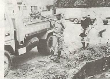
溝さらえで出た汚泥の除去作業(5月21日、若宮町で)