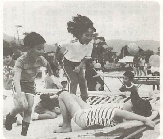
△主役はちびっこたち、雨なんかヘッチャラ 恒例の「青空天国いこいの広場」が5月5日、維新公園で開催された。当日は雨模様でしたが、集った約2万人のちびっこたちは、トランポリンや魚のつかみどりなどに元気な歓声を上げていた。