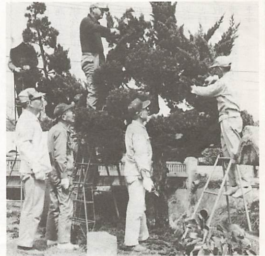
鑄銭司の庭園同好会会員による、植木のせん定奉仕作業。長年培ってきたお年寄りたちの技能が生かされています