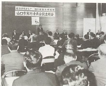
5月17日、市役所大会議室で行われた市実行委員会設立総会