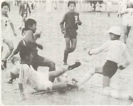
△闘志あふれるプレーに、熱い声援 第九回全日本少年サッカー大会山口市中央大会が、五月十八日・十九日の両日維新公園で開催された。各チームは、悪コンディションにもかかわらず、ドロンコになりながら、熱闘を展開した。