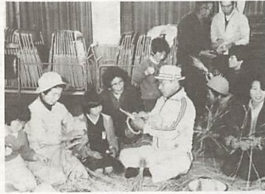
お年寄りたちの技術は、三世交代交流の場にも(小鯖公民館でしめなわ作り)

高齢者の中には、「自分の能力や経験を生かしたい」「健康のため何らかの仕事をしたい」「自分の小づかい、孫の小づかいぐらいは自分の力で」と、お考えの人も大勢いらっしゃるのではないでしょうか。 このような高齢者の人々が、その希望に応じ、経験や能力を生かして働くことができる場を提供するところです。