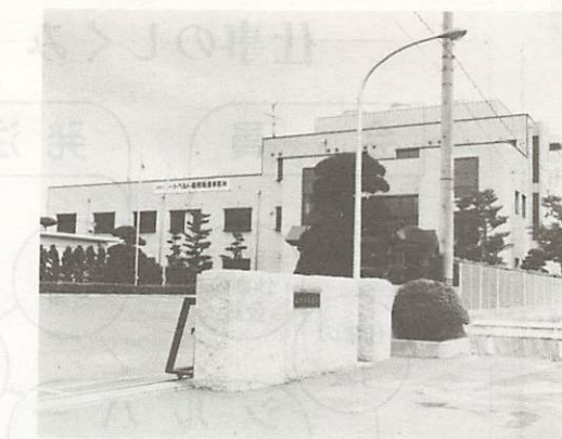
水道局庁舎。昭和10年に給水を開始して、今年で50周年を迎えます