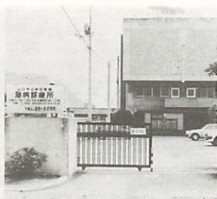
熊野町にある市休日夜間急病診療所(昭和55年開設)