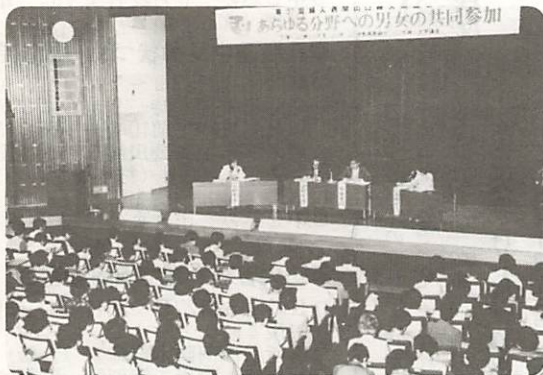
△男女の共同参加をめざして 「あらゆる分野への男女の共同参加『国連婦人の十年』最終年にあたって」をテーマに、山口婦人問題会議が五月二十二日、県視聴覚センターで開かれた。会場には、三百五十人が詰めかけ、シンポジウムや講演などに、熱心に耳を傾けていた。