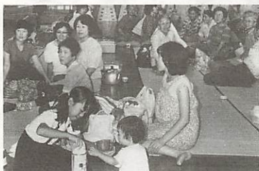
小鯖小学校に避難された柳ヶ宇土ため池周辺の住民(7月3日)

半壊五棟、床上浸水十世帯、床下浸水七十八世帯、流出埋没した水田七十三か所・被害額七千万円、ため池の一部決壊九か所、同決壊一か所、頭首工の決壊十六か所、農道の決壊四十六か所、水路の決壊百二か所、農作物(米・大豆・野菜)の被害約二億円、山地崩壊、二十三か所、林道の決壊七か所、同一部決壊三か所、河川の一部決壊七十五か所、道路の一部決壊三十三か所、橋りょうの一部流出一か所など、被害総額(人的被害及び家屋被害を除く)は、七月八日現在、十三億六千九百万円にの