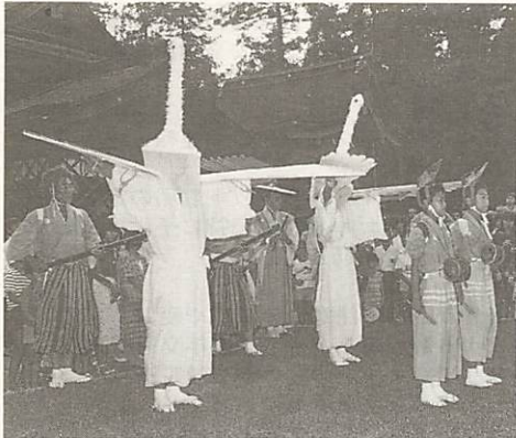
7月20日の午後6時30分から、八坂神社境内で行われる「鷺舞、

中日の二十四日は、午後八時の打ち上げ花火を合図に、商店街などで婦人会や町内会、会社など関係諸団体の参加による、市民総踊りが行われます。