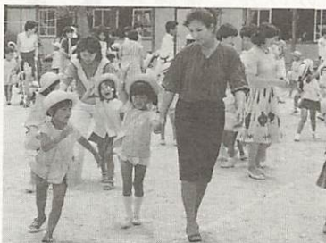
親が教える子供の交通安全

「思いやり みんなのための交通安全、をスローガンに、夏の交通安全健民運動が県下一斉に展開されます。