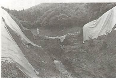
決壊した野口堤。シートなどで応急措置をしています(7月1日)

六月二十一日午後二時ごろから降り始めた豪雨は、二十八日までの間に、六百三十九・五ミリという降水量を記録し、河川や道路、耕地などに大きな被害をもたらしました。一たん、降り止んだ雨は、七月二日午後九時すぎから再び豪雨となり、降り始めの六月二十一日から七月六日までの総降水量は、年間平均降水量の三分の一を越す八百八十九ミリにも達しました。 死者3人 被害額約13億7千万円 このたびの豪雨により、山口市は死者三人、被害額約十三億七千万円という大きな被害を受けました。 被害の内容をみますと、死者三人、負傷者一人の人的被害を受けたほか、家屋の全壊二棟、