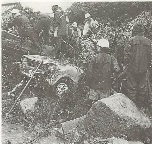
鉄砲水となって、ふもとの人家を直撃した野口堤(吉敷)の被災現地。6月29日撮影

六月二十一日午後二時ごろから降り始めた豪雨は、二十八日までの間に、六百三十九・五ミリという降水量を記録し、河川や道路、耕地などに大きな被害をもたらしました。一たん、降り止んだ雨は、七月二日午後九時すぎから再び豪雨となり、降り始めの六月二十一日から七月六日までの総降水量は、年間平均降水量の三分の一を越す八百八十九ミリにも達しました。 死者3人 被害額約13億7千万円 このたびの豪雨により、山口市は死者三人、被害額約十三億七千万円という大きな被害を受けました。 被害の内容をみますと、死者三人、負傷者一人の人的被害を受けたほか、家屋の全壊二棟、