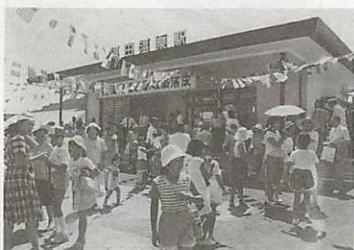
落成を祝う地元関係者