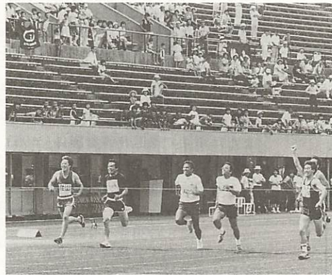
市民スポーツの祭典、市民体育大会。地区の榮譽を担う選手に、力強い声援を

○卓球(男子・女子、四シングル・ダブルスによる予選リーグ、決勝トーナメント戦) 県スポーツ文化センターレクチャールーム ○サッカー(スポーツ少年団対抗によるトーナメント戦) 維新百年記念公園補助競技場、球技場、ラグビー場 サッカー競技は、地区対抗の得点には加算されません。