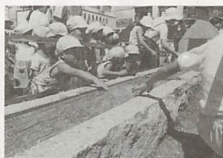
60℃の温泉が1分間に6ℓ流れる温泉モニュメント

造り約百十平方メートルで、総工費は約二千六百万円。全体がクリーム色でまとめられ、屋根部分は寄せ棟コロニアル重ね積みによる和風こけら葺イメージが取り入れられるなど、温泉地の駅舎らしい配慮がされています。