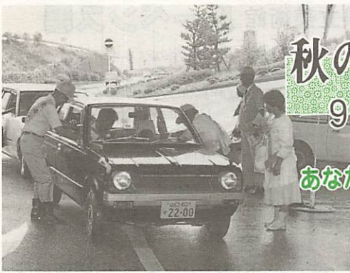
シートベルト いつも乗るたび 乗せるたび

大綱を策定したいと考えています。なお、本市の職員給与については、自治省から個別指導を受けることになりましたが、給与の適正化については、本市行革でも重点事項として部会で取り組んでいますので、併せて検討を進め、是正計画を策定したいと考えています。