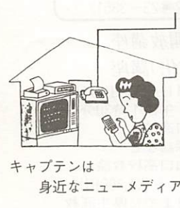
キャブテンは身近なニューメディア

予定ですが、この一日も早いサービスの開始を、去る八月二十日、山口県及び二市一町で日本電信電話(株)へ要望しました。