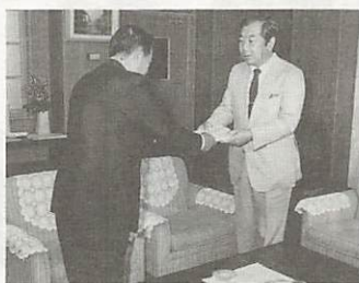
まちづくり懇話会・八木会長から提言書を受ける堀市長

山口のまちづくりに関する提言については、昨年八月、四十六名からなる委員により「山口のまちづくり懇話会」が結成さ