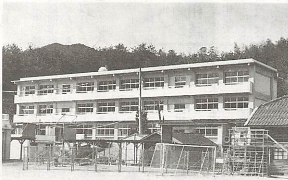
小鯖小学校の新校舎