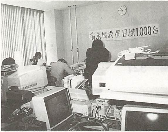
市内熊野町のNNTTの一室に設置されている「山口地区テレトピア推進室」

テレトピアの推進状況 ☎ 23-8787へ 山口地区テレトピア推進室では、上記の電話でキャブテンシステムなどについて、テレホンサービスを行っています。ご利用ください。