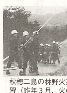
秋穂二島の林野火災消防演習(昨年3月、火の山で)