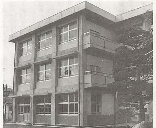
宮野中学校の新校舎