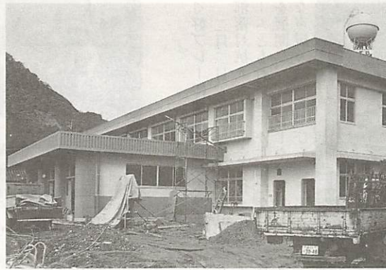
多目的スペースのある白石小学校新校舎