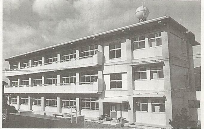
湯上中学校の新校舎

市では、学校施設の整備を年次計画により実施しています。湯上・宮野の両中学校および小鯖・白石の両小学校の新校舎が完成間近になりました。四校の増、改築工事で、約三千五百平方メートルの老朽校舎が解消されます。また、大歳小学校の運動場拡張工事など、総事業費八億六千三百万円の義務教育施設の整備事業のなかから、その主なものを紹介します。