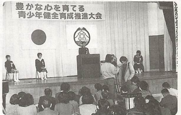
△地域ぐるみで、青少年健全育成!

◁3台の天体望遠鏡で、冬の星座観測 二月七日から三日間、鑄銭司公民館で「天文教室」が開かれ、約百人の親子が天体望遠鏡で見た星の輝きに感嘆の声を上げた。三月二十一日には、ハレーすい星を見る会を計画している。