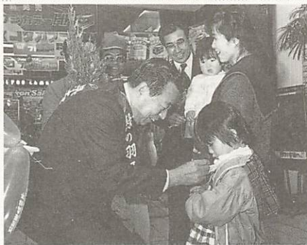
「1本でも多くの緑を、(米屋町で、昨年)

へは協力を呼びかけます。また、三月一日には、米屋町と道場門前で街頭宣伝も行います。 なお、昨年この期間中に皆さんから寄せられた募金額は、百五十七万三千七百七十五円で、学校緑化や地域緑化の推進に役立てられました。ご協力ありがとうございました。