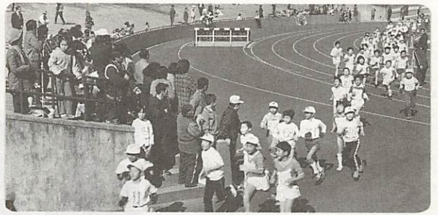
△力走、力走。1,054人が力走

◁好プレーに地域の輪が広がる 二月二日、名田島地区では恒例の五部対抗サッカー大会を行った。各チームとも若い選手が主軸となつて試合を展開し、好プレーや珍プレーに大きな声援・激励が飛び交つた。