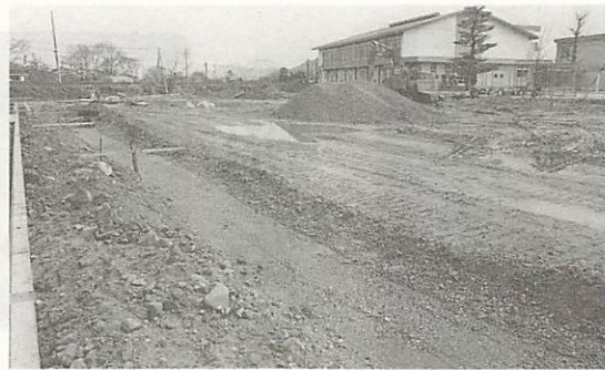
急ピッチで進む、大歳小学校運動場拡張工事

また、小・中学校の環境整備や教育施設整備など、快適な教育環境づくりは年次計画により実施します。