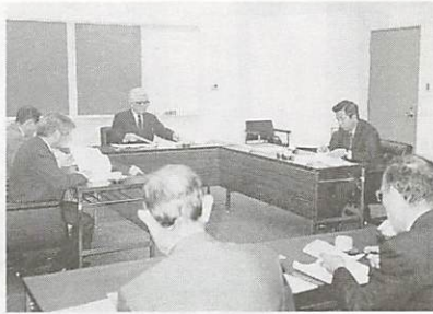
山口県央部中核都市圏構想策定協議会の設立総会(5月1日、防府市で)