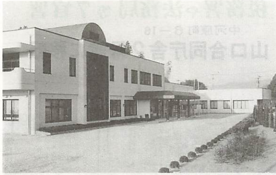
健康づくりの拠点となる保健センター（手前）と休日夜間急病診療所