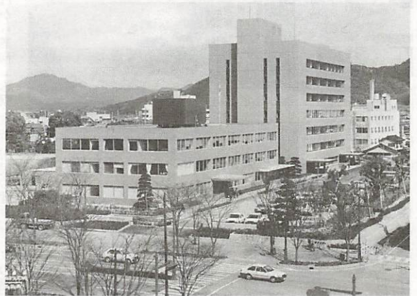
奥の高い建物が新設の山口合同庁舎2号館 (手前は1号館)