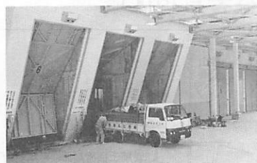
広くなったピット

山口市と周辺三町(小郡町・秋穂町・阿東町)で構成している山口県中部環境施設組合が、総工費約十五億二千八百万円をかけて進めていた清掃工場(大内)の焼却炉増設・整備がこのほど終わり、ゴミ処理能力が大幅に向上しました。 これは、ゴミの増加と施設の老朽化に対応するために昭和六十年十月から行われていたものですが、最近の急激なゴミの増加により一日も早い完成が待たれていました。 今回の工事では、全連続燃