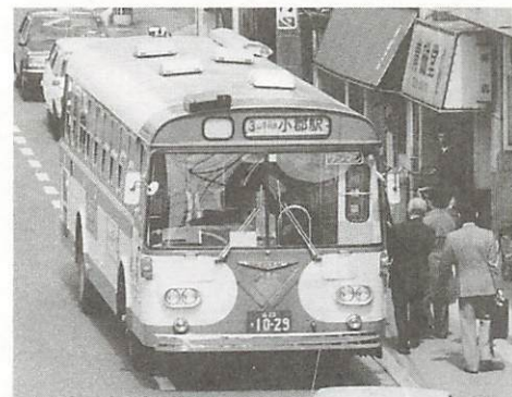
4月1日から、改善実施計画にそって新体制で業務を行う市営バス。市民の足として、みなでご利用ください

歳出の主なものは、退職金二億八百万円、吉敷出張所用地購入費一千五百余万円、バス路線維持費補助金三百余万円、老人保健特別会計繰出金一千九百余万円、同対策資金貸付事業特別会計繰出金五千二百余万円、山口市・秋穂町水道企業団に対する負担金三千五百余万円、湛水防除等県事業負担金三千四百余万円、道路新設改良等県事業