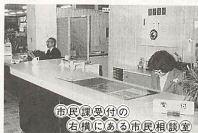
市民課受付の 右横にある市民相談室

市では、市広報広聴モニター制度のほか、直接、市民の皆様から市政への要望や提言を聞いたり、また、市民生活上の相談に応じるため、『市民相談室』を設置しています。 相談室は、市役所一階の市民課受付の右横にあります。電話22-4111でも相談に応じますが、気軽にお越しください。