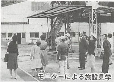
モニターによる施設見学

昭和六十二年度の市広報広聴モニターを勤めていただく、十六人のかたが、下表のとおり、決まりました。 モニターの任期は一年で、主な仕事は市と市民のパイプ役として、地区の話題や市政への要望を市に寄せていただくことで、モニター制度は昭和五十二年