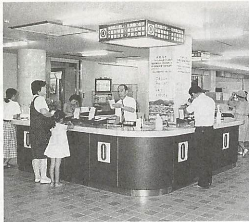
市民課の窓口（玄関から正面）

戸籍の届出は、3番窓口 市役所1階の市民課の窓口は0番から3番までです。0番は交付受付、1番は外人登録・住居表示・臨時運行許可、2番はレジ、3番は届出受付。（4番～6番は保険年金の窓口）