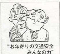
“お年寄りの交通安全 みんなの力”

交通安全山口県対策協議会、山口県、山口市など県下市町村では、9月を「お年寄りの交通安全強調月間」に定め、県民一人ひとりがお年寄りの交通安全に対する理解と認識を深め、お年寄りの交通事故の防止を図ります。