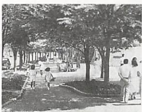
美しさと機能性が高く評価されたパークロード

パークロード 「日本の道100選」に 八月三日、建設省の「日本の道100選」にパークロード(県道厳島早間田線)が選ばれました。