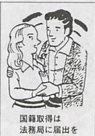
国籍取得は法務局に届出を

この届出によって日本の国籍を取得できる場合はいくつかありますが、そのうち、改正国籍法施行前に外国人父と日本人母との間に生まれた子の国籍取得の届出は、特に改正国籍法の施行日から三年以内(本年十二月三十一日まで)に限ってすることができるとされています。届出の期限が迫っていますので、この届出をしようとする人は、早目に最寄りの法務局に相談するようにしてください。