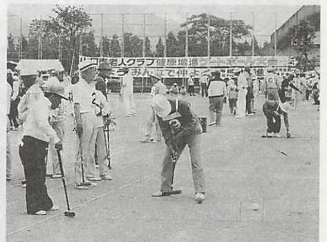
健康増進ゲートボール大会(5月27日)

山口市では、現在、健康・福祉システム、学習・社会参加システム、人材・能力開発システムの三つを柱とする「長寿社会対策」の大綱策定中であり、人