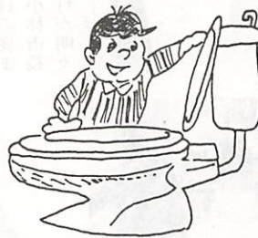
清潔で快適な水洗トイレ

公共下水道に汚水を流すためには、各家庭で排水設備(私設下水道)をつくらなければなりません。宅地や私道内に排水管、汚水ます、雨水ますなどを個人