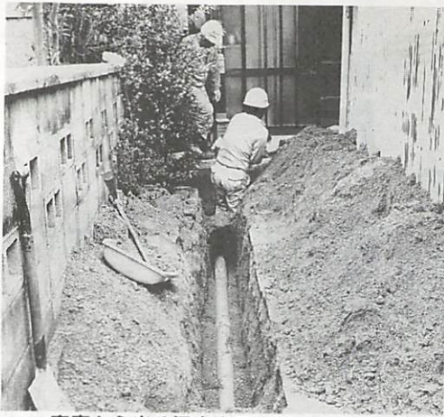
家庭から出る汚水を下水管に流すための排水設備工事

排水設備の相談に応じます 市下水道管理課 (市役所2階☎22-4111) に排水設備相談コーナーを設けています。家庭内排水施設等のご相談に活用ください。