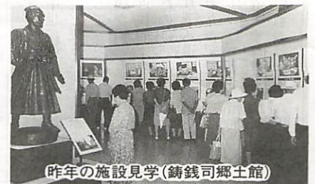
昨年の施設見学（鑄銭司郷土館）