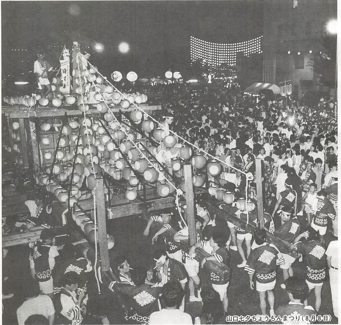
山口七夕ちょうちんまつり(8月8日)

七月の祇園祭に始まり、八月の七夕ちょうちんまつり、宮野の花火大会、そして各地区の盆踊り大会、地元にも古くから伝わる祭り、と山口の夏を彩った数々の祭りも終わりました。 人と人の心をつなぐ祭り。この時期、都会に就職した人や大学生など遠くから多くの人々が帰省し、ふれあひも深まりました。 暦の上では、もう秋に入っています。秋は、スポーツ、読書などに絶好の季節で身も心も充実します。 学校では、長かった夏休みも終わり二学期が始まります。今年には、例年に比べ交通事故が多発しています。登下校の子供たちには十分気を付け、交通事故を起こさないように注意しましょう。