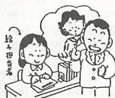
配偶者特別控除が新たに創設されました

毛布、綿布、縄等を蛇口や水道管などにまきつけて、保温します。また、発泡スチロールの内部をくり抜いて蛇口をカバーするのもよいでしょう。 ○凍結したら 蛇口を開いて、タオル等を巻き、その上からゆつくりとぬるま湯をかけてください。急に熱湯をかけると破裂したり、蛇口をいためることがあるので注意しましょう。 ○破損したら 元栓(止水栓、内バルブ)をしめて、市指定の水道工事に連絡してください。