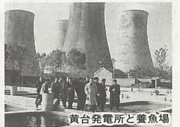
黄台発電所と養魚場