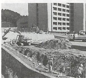
県警察棟 起工 地上9階建の庁舎に

県警察棟の起工式が11月12日、県庁本館棟西側の建設現場で行われました。新築される警察棟は、鉄筋コンクリート造り地下1階、地上9階、塔屋2階の建物。建築面積は約3千700平方メートルで、周辺環境と調和し、親しみがもてる、21世紀を展望した機能性・対応性等を備えた庁舎となるよう配慮されています。工期は、昭和65年3月31日までです。