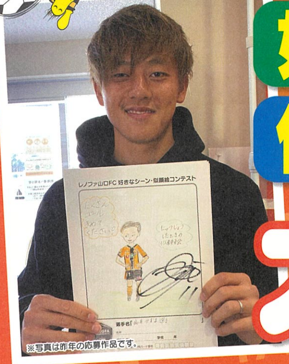
※写真は今年の応募作品です。

山口市立中央図書館では、レノファ山口FCの選手をテーマとした「好きなシーン」や「似顔絵」を募集します。選手の笑顔、シュートシーン、キャッチングシーン等どんな絵でも結構です。応募いただいた中から、描かれた選手自らが一枚お気に入りを決めて、絵と一緒に写真撮影と選手本人の直筆サインを絵に入れて応募者にお返しします。さらに、応募してくれた人全員の中から抽選で10名にレノファグッズが当たるWチャンスも!!