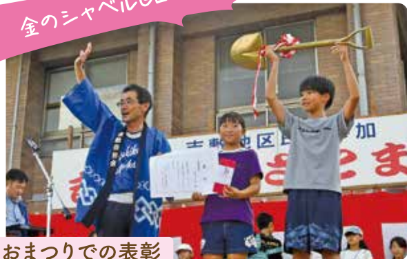
おまつりでの表彰