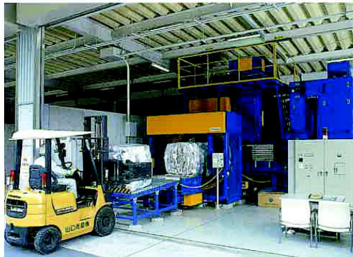
あっしゅくされた容器包装は、こんぼうされて出てくる