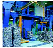
プレス機 (かんをおしつぶす)