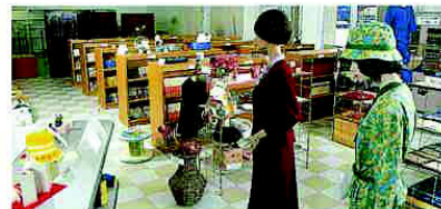
てんじ・はんばいコーナー リサイクルじょうほうコーナー