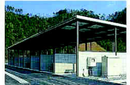
ストックヤード (びん・かんを保管するところ)