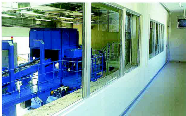
見学者ギャラリー

いらなくなった本や服を必要な人にゆずるためのお手伝いもしています。古くなったものがもう一度役に立って、とてもいいことだね。