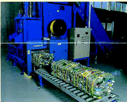
こんぼう機・ペール出口