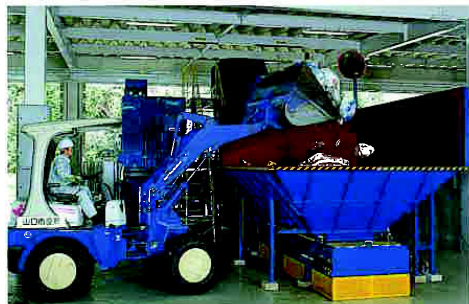
集まった容器包装をあっしゅく機に入れる