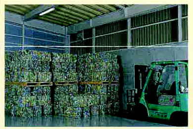
ペール保管するところ