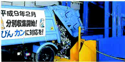
バッカー車から入れもの