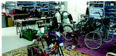
しみんこうぼう・けんしゅうかつどうしつ