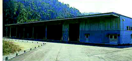
ストックヤード (新聞や雑誌がみを保管するところ)