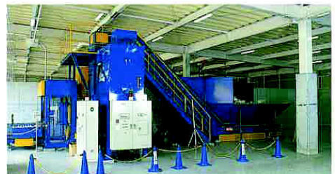
あっしゅく・こんぼう機を機から見ると