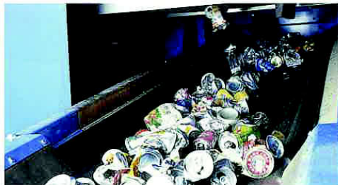
選別コンベヤーとスチールせんき