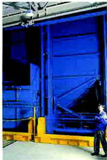
ちよさうされる入れ物