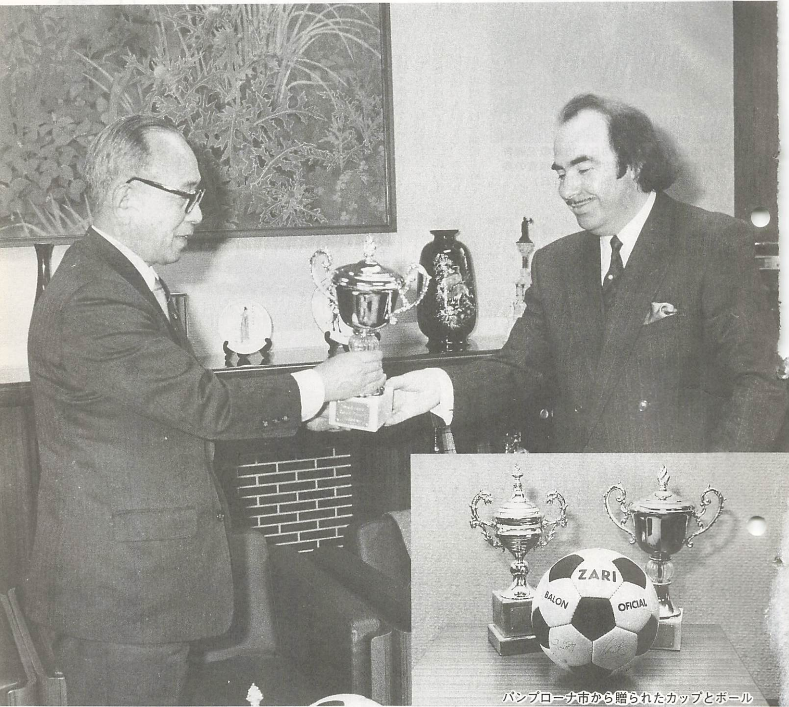
パンプローナ市から贈られたカップとボール