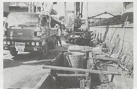
本年度末には、4百70畝の面的整備を終える公共下水道工事(写真は大殿)

この時期に更に新しい計画区域の設定が必要と考えられますので、近年、人口増加の著しい市街地周辺地域である朝倉、宮野、吉敷、大蔵、平川及び大内地区の一部について合計9百75畝を新たな公共下水道の区域として、去る2月26日に県の都市計画地方審議会の審議を経て、このほど県知事の承認のもとに都市計画決定をしたところです。