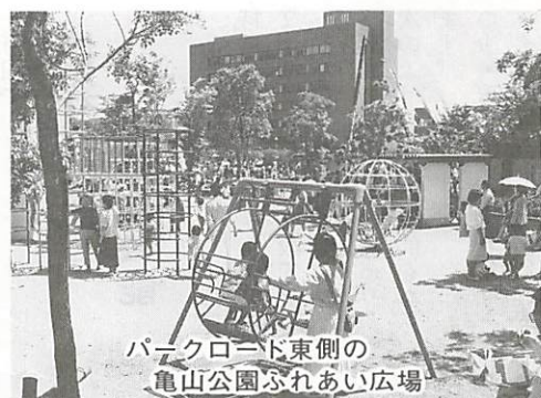
パークロード東側の亀山公園ふれあい広場

することが決められました。次いで、応募愛称の分類の中で、市民のふれあいのなものが一番多く、この中から選定することが決められ、最後に「ふれあい」に関係した愛称が13件と多く、この中で「ふれあい広場」は2件であるが、わかりやすく親しみがあるもので、この愛称に決定するという3段階で審査されました。この愛称決定により、今後